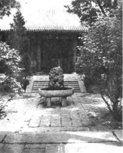
天香庭院，锡晋斋仿故宫 乐寿堂建筑（今在北京恭王府内）