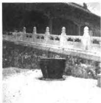
和珅宅中“太平缸” (今 在故宫景运门外)