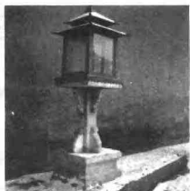
和珅宅中路灯 (今在故 宫隆宗门外)