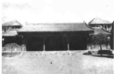
咸安宫大门（和坤读书处）