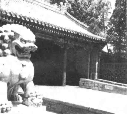
原和坤宅第大门，今恭王府大门（今北京西城前海西街）