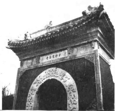
淑春园内花神庙山门（今 在北京大学校园内）