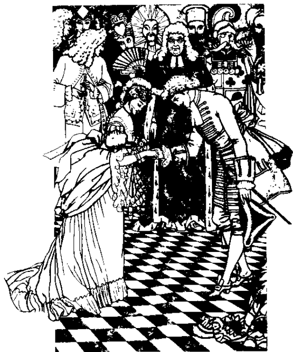
— 100 — 莎士比亚戏剧集 卷之九 亨利八世