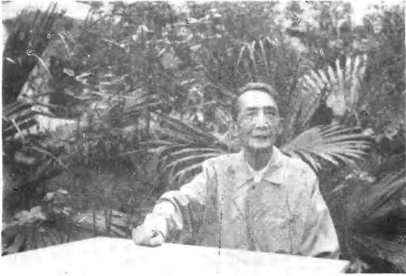
一九八九年秋作者摄于四川人民医院五号楼下