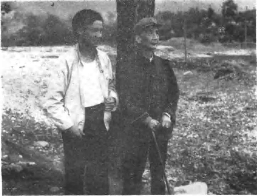
一九八五年作者与孩子刚宜于安县雒水关旧居外