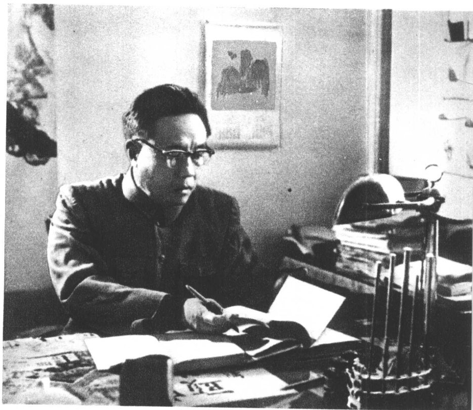
艾思奇同志在书房里