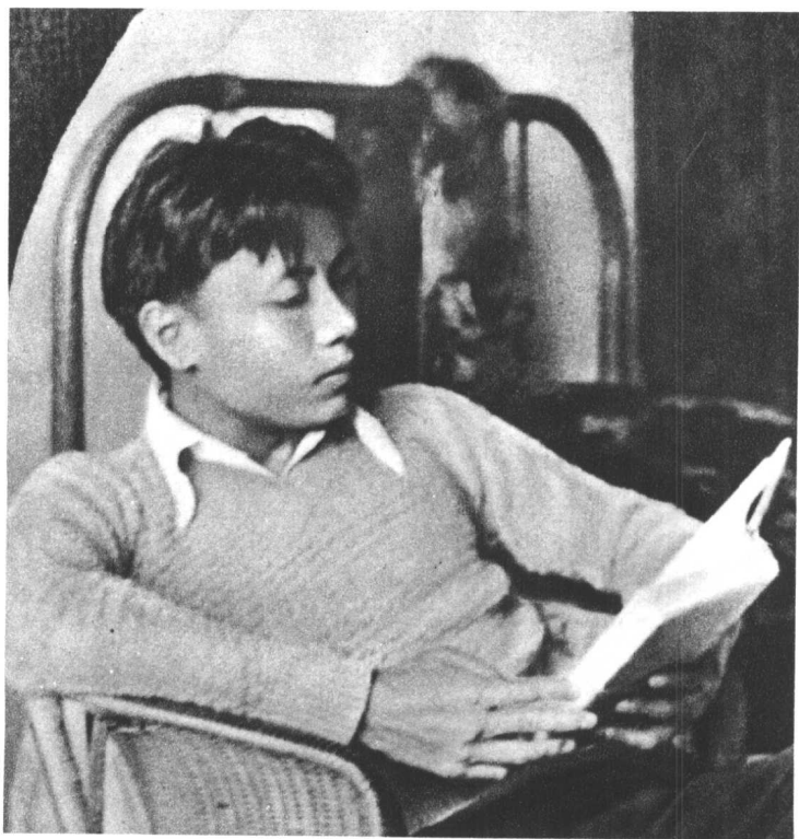
青年时期的艾思奇同志在读书