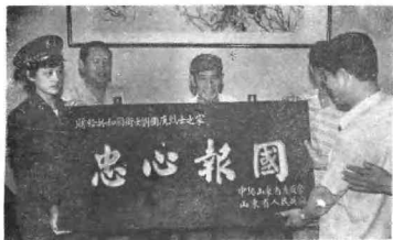
中共山东省委书记姜春云，省委副书记、省长赵志浩向“共和国卫士”刘国庚烈士的父亲刘志荣赠送题有“忠心报国”的匾额。