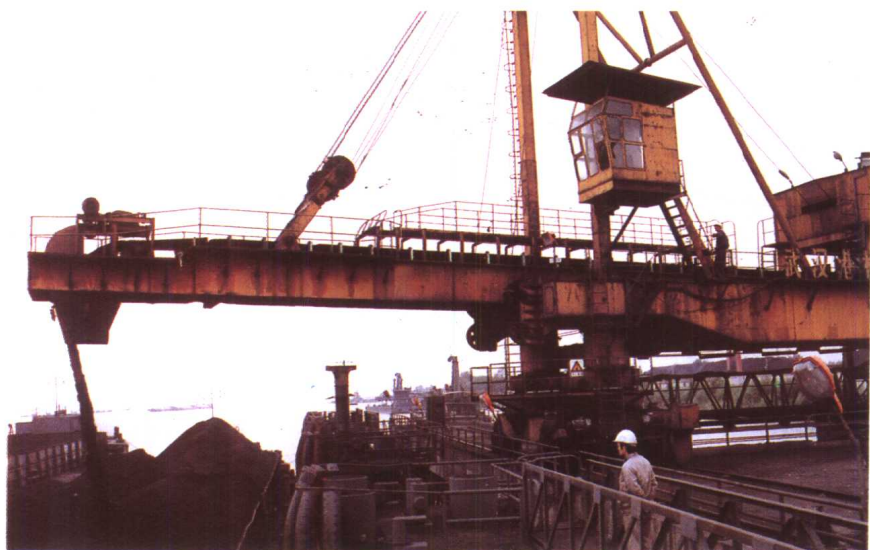
△ 浦口机械化煤码头