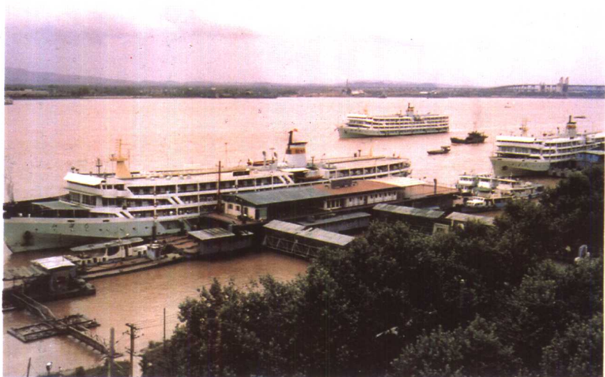
△ 南京下关客运码头