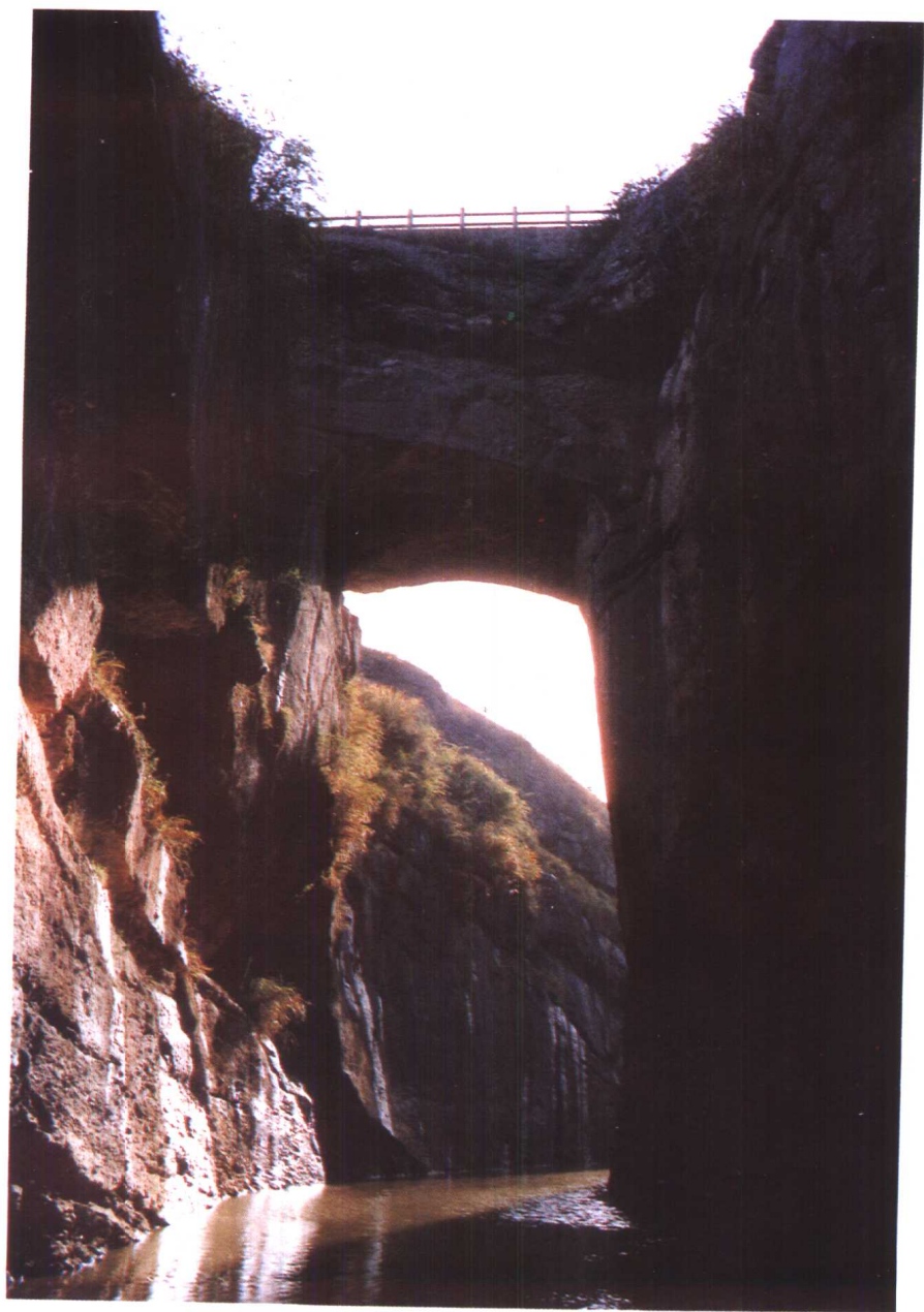
△ 建于明洪武年间的漂水县天生桥