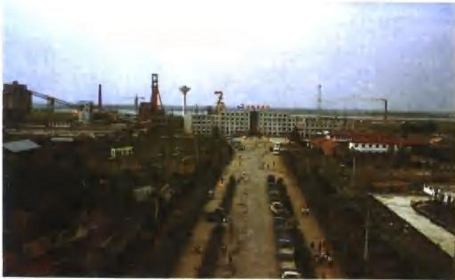
新集二矿 (花家湖煤矿)远 眺