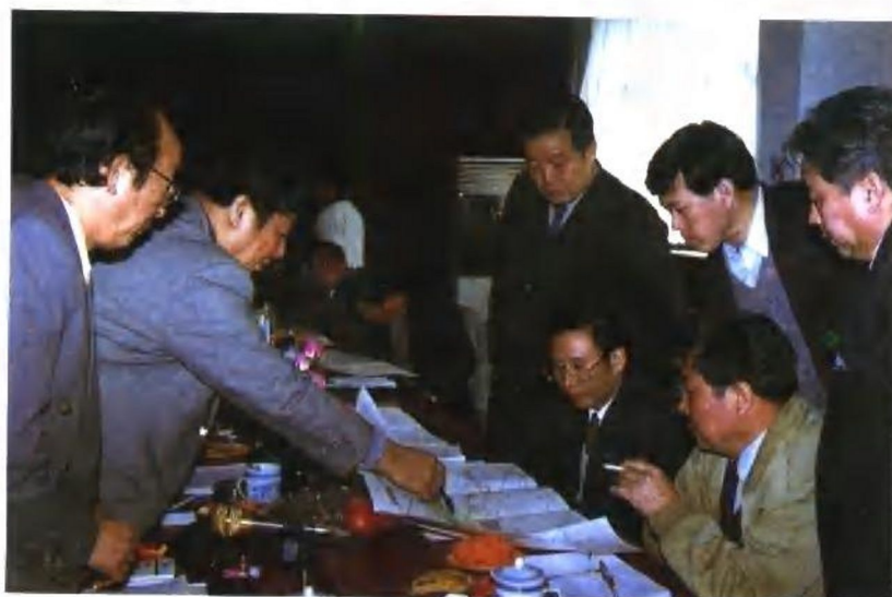
1996年元月9日,国家开发银行副行长姚中民视察新集矿区