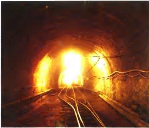
井下光爆锚喷巷道