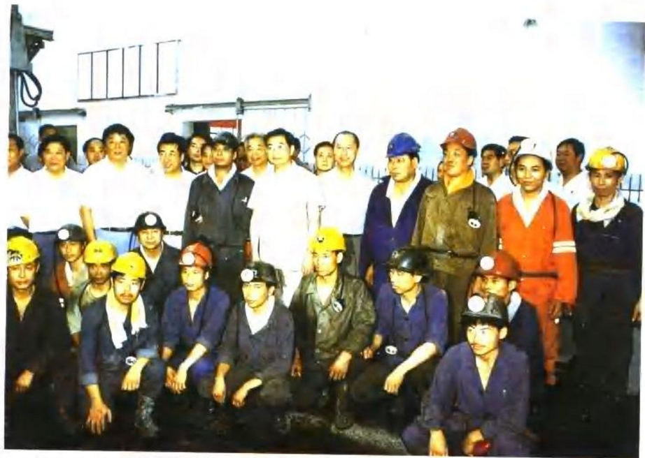
1996年7月22日,中共中央政治局常委,中共中央书记处书记胡锦涛同志视察新集矿区时与干部、工人们在一起