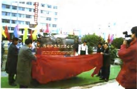
1996年元月17日,淮南新集集团总公司成立