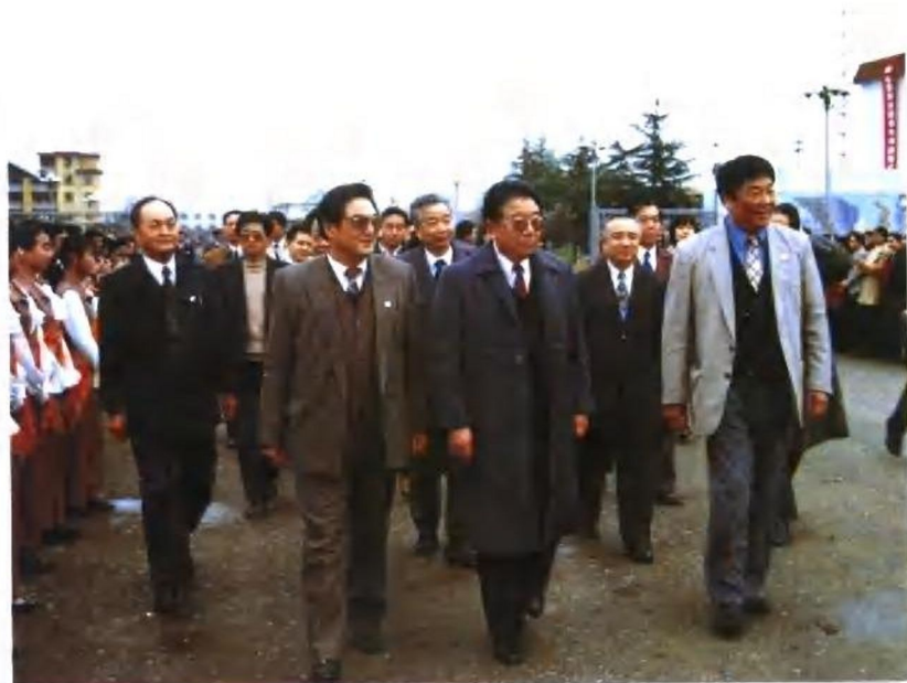
1996年4月13日,煤炭工业部副部长张宝明(中)视察新集矿区