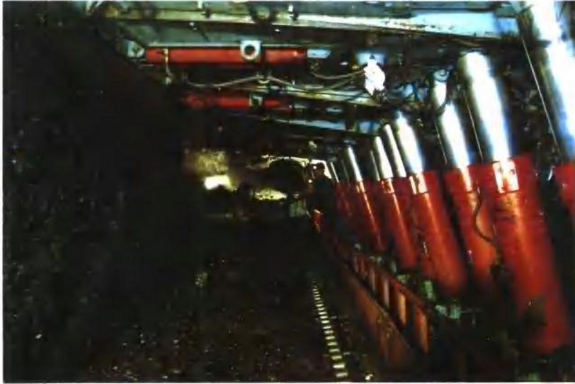
新集煤矿综采放顶煤工作面