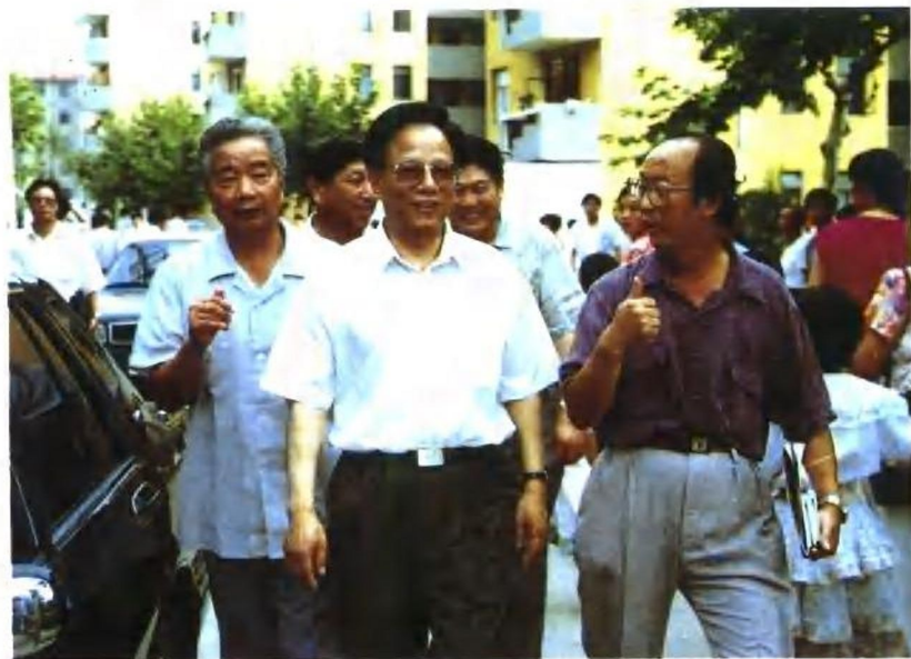
1995年7月2日,煤炭工业部部长王森浩(中)视察新集矿区