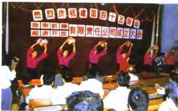
1994年9月30日,淮南新集能源开发有限责任公司成立