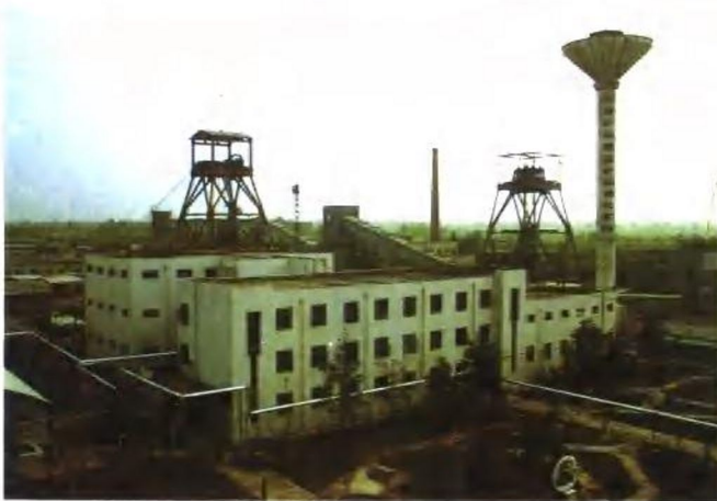
新集三矿 (八里塘煤矿)外 貌