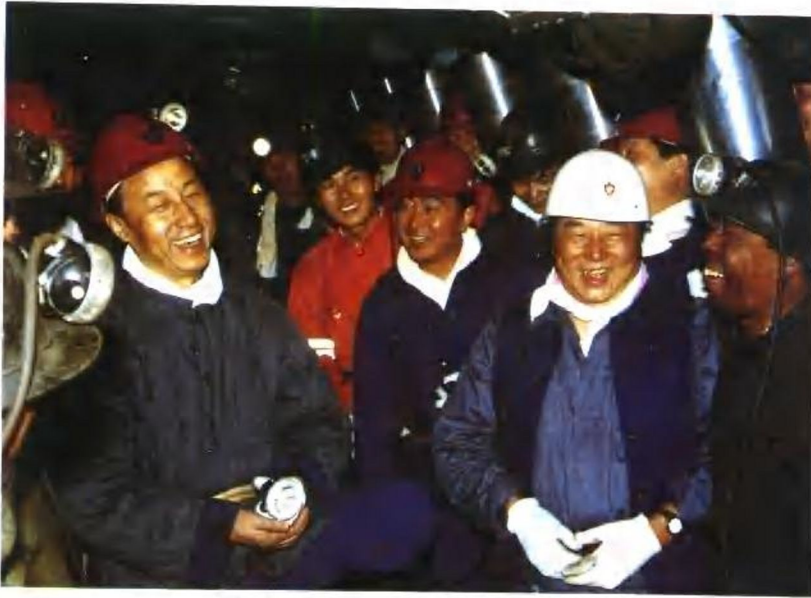
1994年春节,安徽省委书记卢荣景(左一)到新集煤矿井下视察慰问