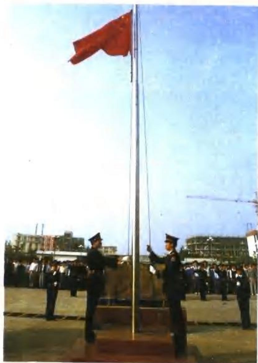
七年如一日,坚持早升旗仪式