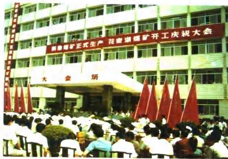
1993年7月1日,新集一矿三年半建成正式生产,新集二矿开工庆祝大会会场