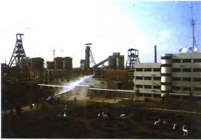
新集一矿 (新集煤矿)外貌