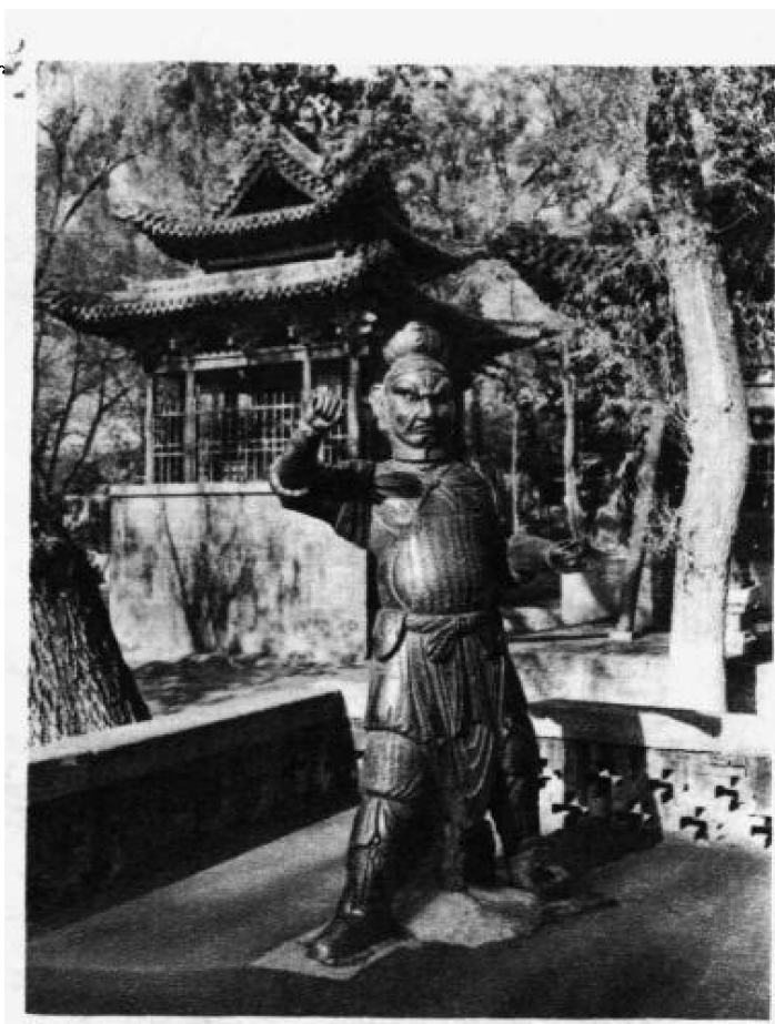
宋 铸 铁 人

越过对越坊及钟楼、鼓楼到献殿。此殿原为陈设祭品的场所，始建于金大定八年(1168年)，面宽三间，深两间，梁架很有特色，只在四椽袱上放一