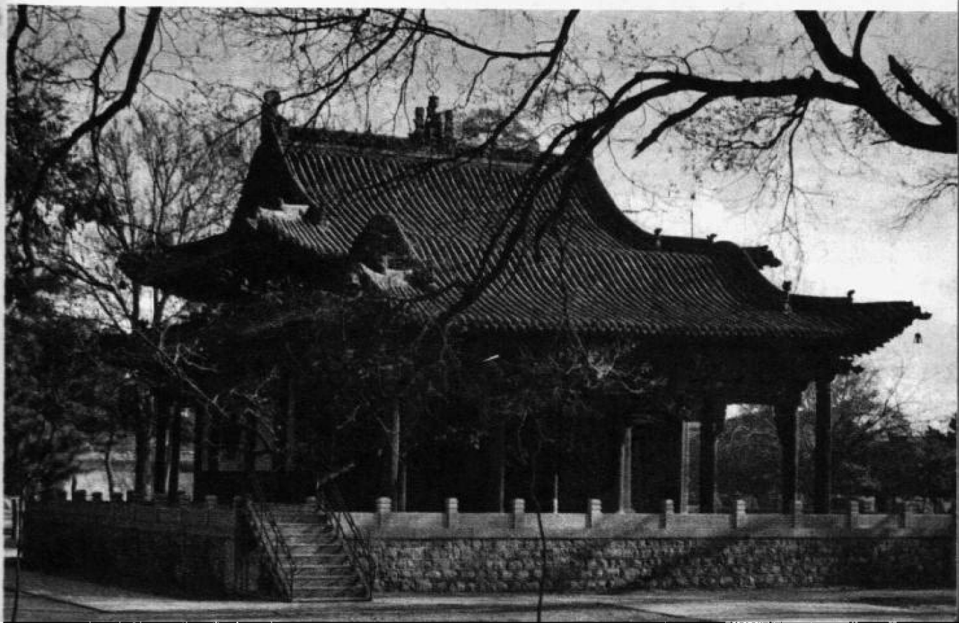
水 镜 台

中轴线最前端为水镜台,始建于明朝,是当时演戏的舞台。前部为单檐卷棚顶,后部为重檐歇山顶。除前面的较为宽敞的舞台外,其余三面均有明朗的走廊,建筑式样别致。