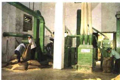
▲市植物油加工厂生产线