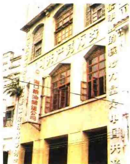
▲1950—1977年市粮食局办公楼(水巷口56号)