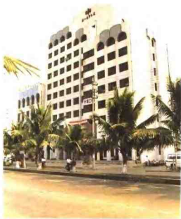
▲1990年市粮食局办公楼(长坦路)