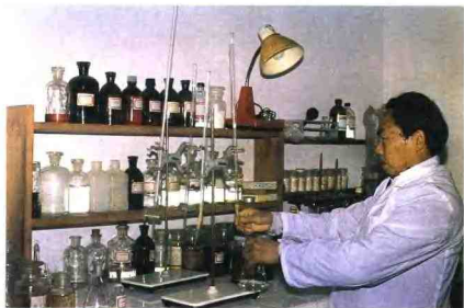
▲粮食转运站防化室粮质检验