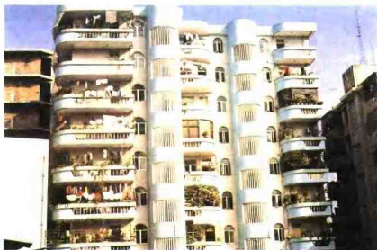
▲80年代市粮食局职工宿舍(长堤东路)