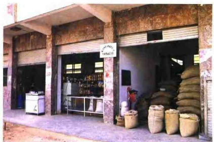
▲泰黄粮业公司多种经营