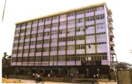
▲市秀英粮油供应公司办公楼