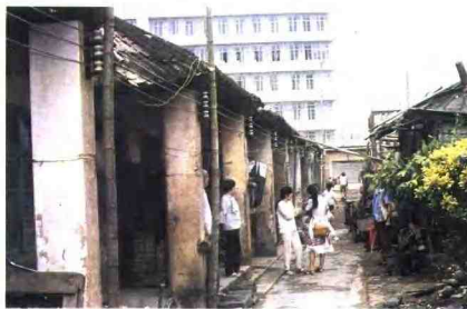
▲60年代市粮食局职工宿舍(海甸)