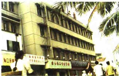
▲1978—1988年市粮食局办公楼(长堤路)