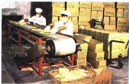
▲市面粉制品厂生产线