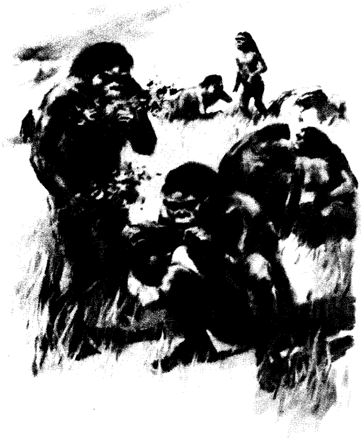
猿人（南猿）的生活情景