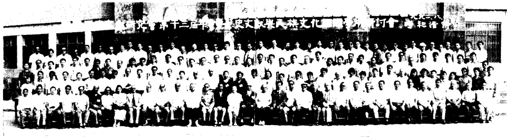
中国历史文献研究会第十三届年会暨历史文献与民族文化国际学术研讨会 1992年 呼和浩特