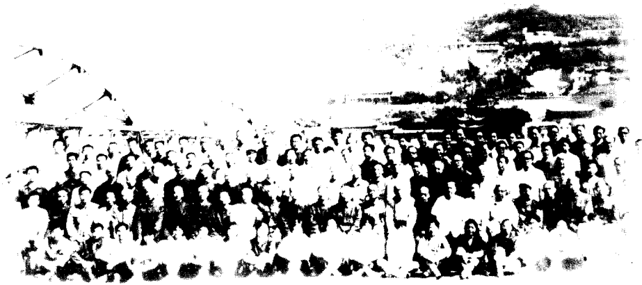
中国历史文献研究会第三届年会全体同志留影 1982年7月兰州