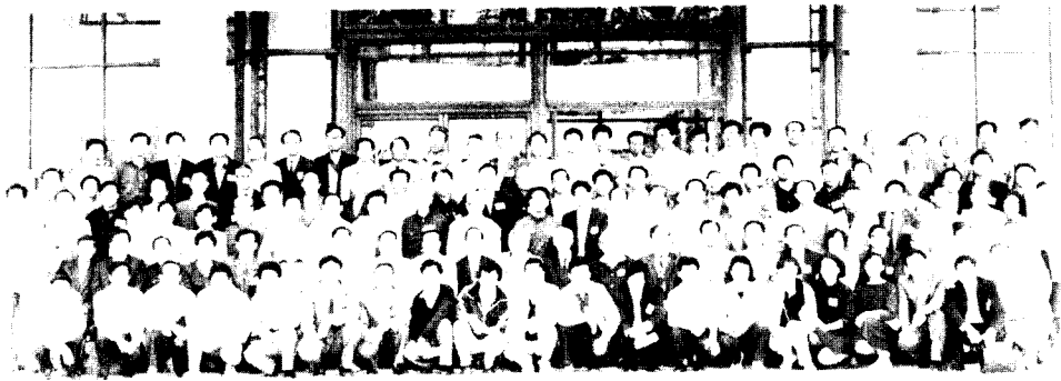
中国历史文献研究会第十一届年会暨潮汕历史文献与文化学术讨论会 1990年 汕头