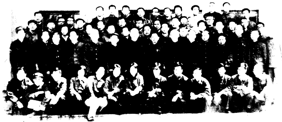
中国历史文献研究会第一届年会全体代表合影 1980年5月于武昌