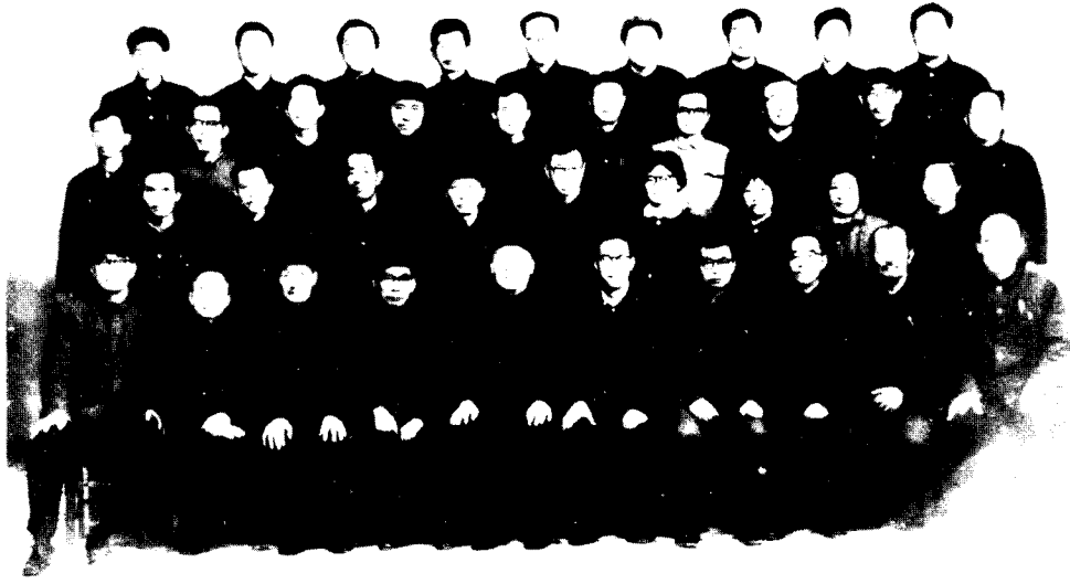
中国历史文献研究会成立大会留影 1979年4月4日于桂林