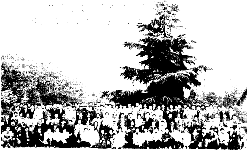
中国历史文献研究会第十二届年会 暨：“汉唐史籍与传统文化”研讨会留念 1991.10 西安