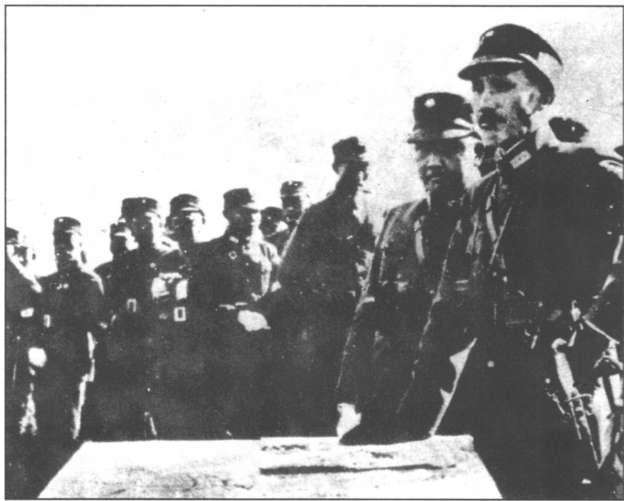
蒋介石在“围剿”前线督阵。