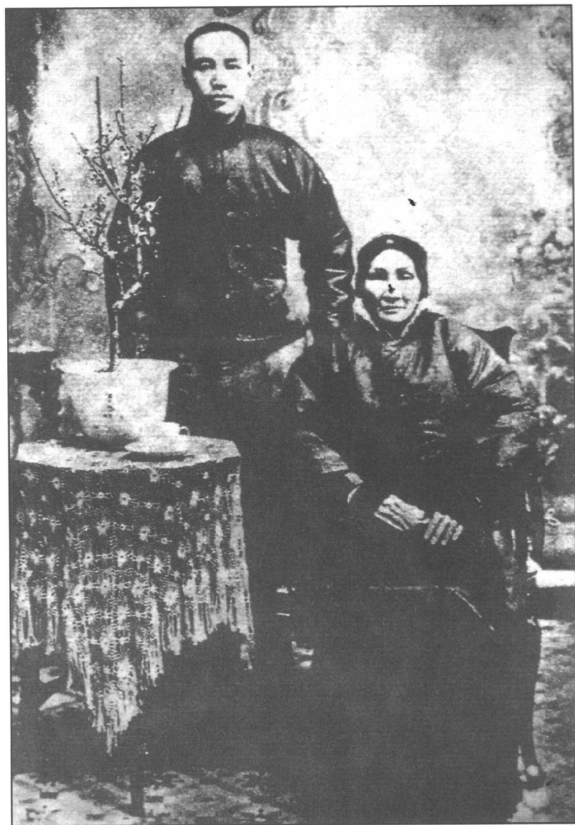
蒋介石八岁丧父后，由母亲王采玉抚育成人。