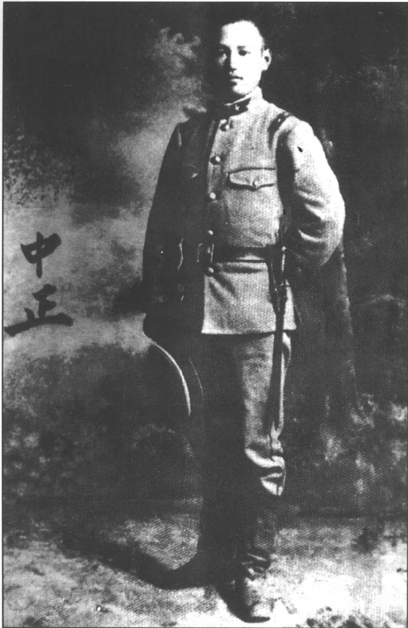
蒋介石在日本振武学校学习结业后，被派往日本陆军第十三师野炮兵第十九联队实习。