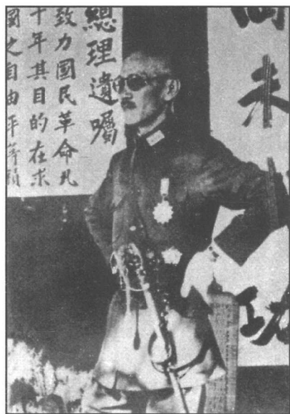
蒋介石在南昌指挥“围剿”红军。