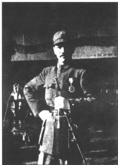
1930年12月至1934年10月，蒋介石向中国工农红军和革命根据地先后发动五次军事“围剿”。图为他在江西前线督师。