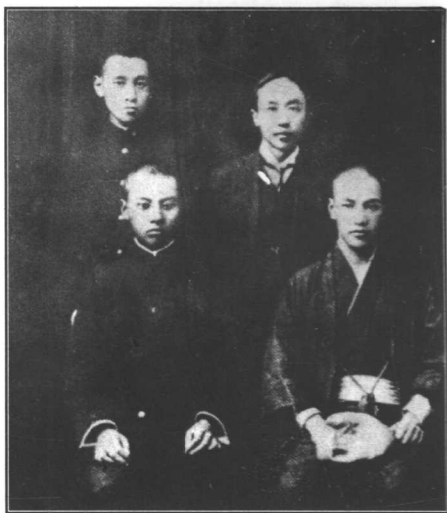
蒋介石(前排右)与留日同学张群(前排左)等在东京合影。