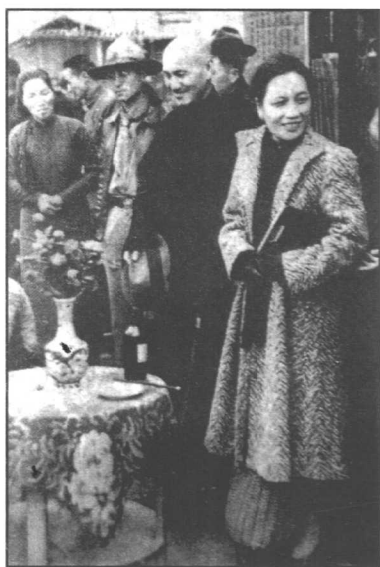
1934年2月，蒋介石发起“新生活运动”，图为他 and 宋美龄在南昌街头视察“新生活运动”的展览。