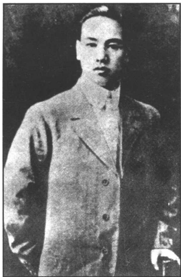
辛亥革命时期的蒋介石