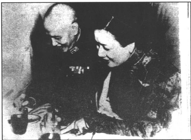
1942年1月，蒋介石出任中国战区陆空军最高统帅，图 为他在就任书上签字，右为宋美龄。