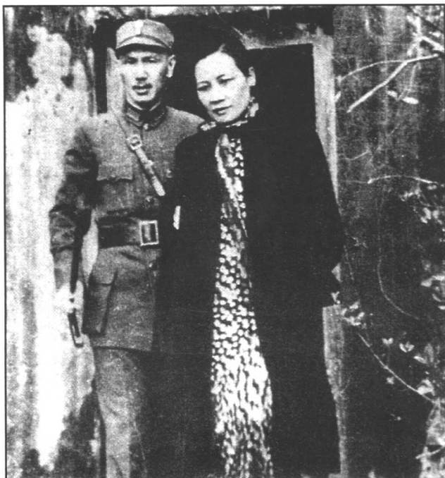
1939年5月3日， 蒋介石与宋美龄 在日军轰炸重庆 后步出防空洞。