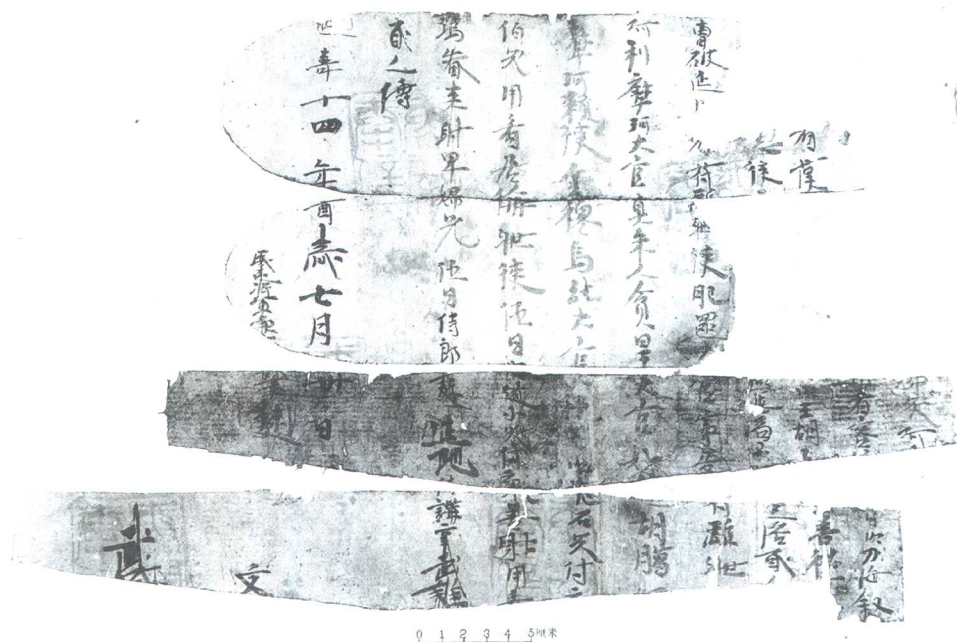
图八 高昌窆文泰延寿十四年(637年)七月卅日兵部差人看客馆客使文书(二)