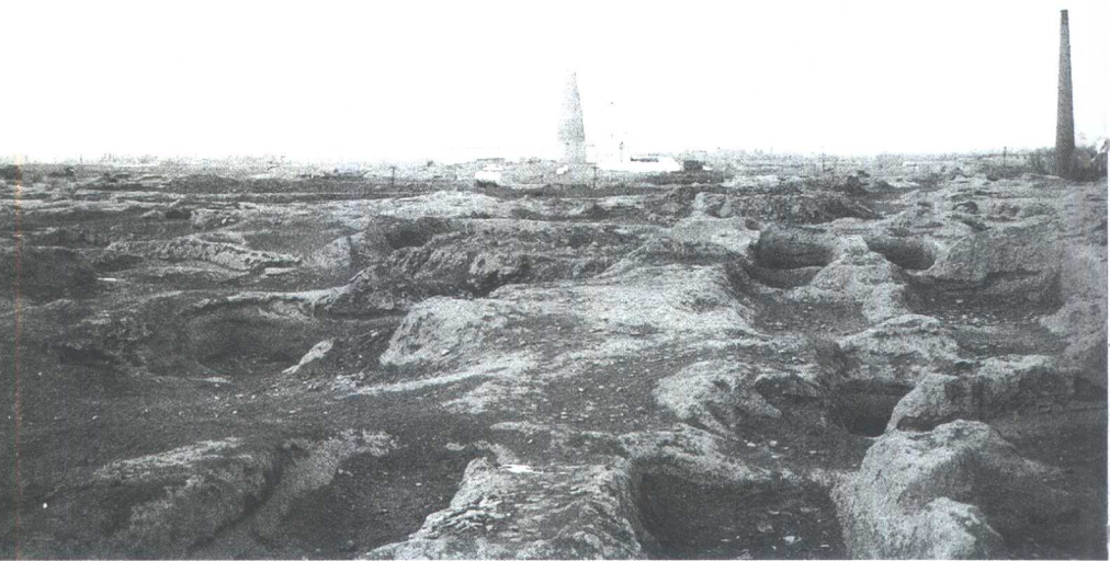
图四 安乐故城