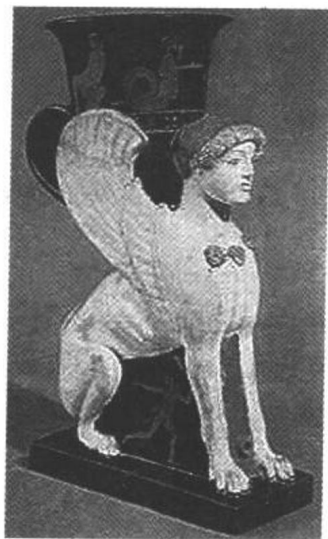
狮身人面女妖斯芬克斯

2、斯芬克斯之谜。传说斯芬克斯是希腊神话中带翅膀的狮身人面女妖。赫拉派她到忒拜，给忒拜人出了一个谜，谜面是：什么动物早晨用 4 只脚，中午用两只脚，晚上用 3 只脚走路？脚最多的时候，正是他走路最慢，体力最弱的时候？忒拜人解不开这个谜语。谁猜错了，她就把谁吃掉，俄狄浦斯揭开了她的谜底是人，她因羞愧投崖而死。斯芬克斯这个名字常用来比喻难以猜度、让人捉摸不透的人或事物。