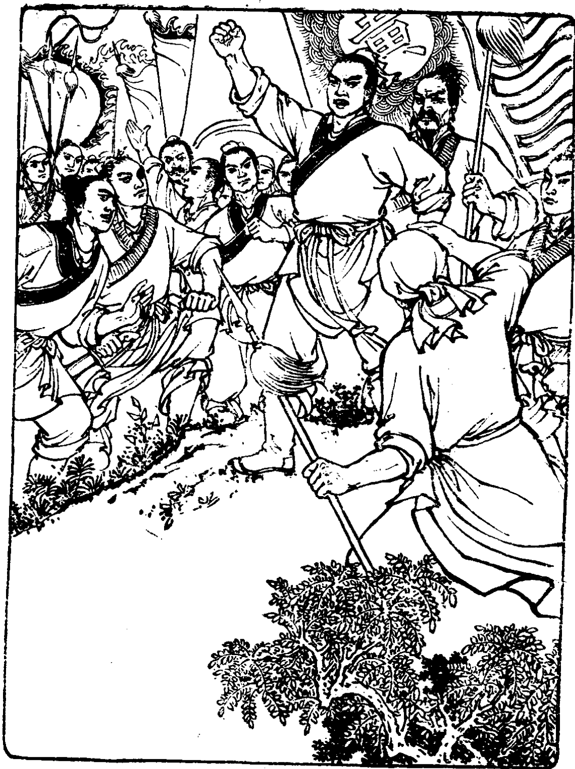
广大农民纷纷参加起义