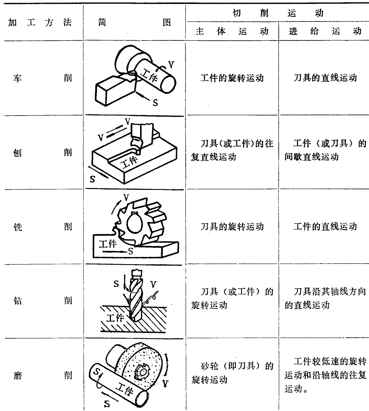
表 1-1 常用机床上的切削运动

② 大部分机床的主体运动都是旋转运动。如表 1-1 所示车削时工件的旋转运动 V ，铣削时铣刀的旋转运动 V ……等。而少数机床（如刨床、插床、拉床等）的主运动是直线运动。如表 1-1 中刨削时刨刀（或工件）的往复直线运动 V 。