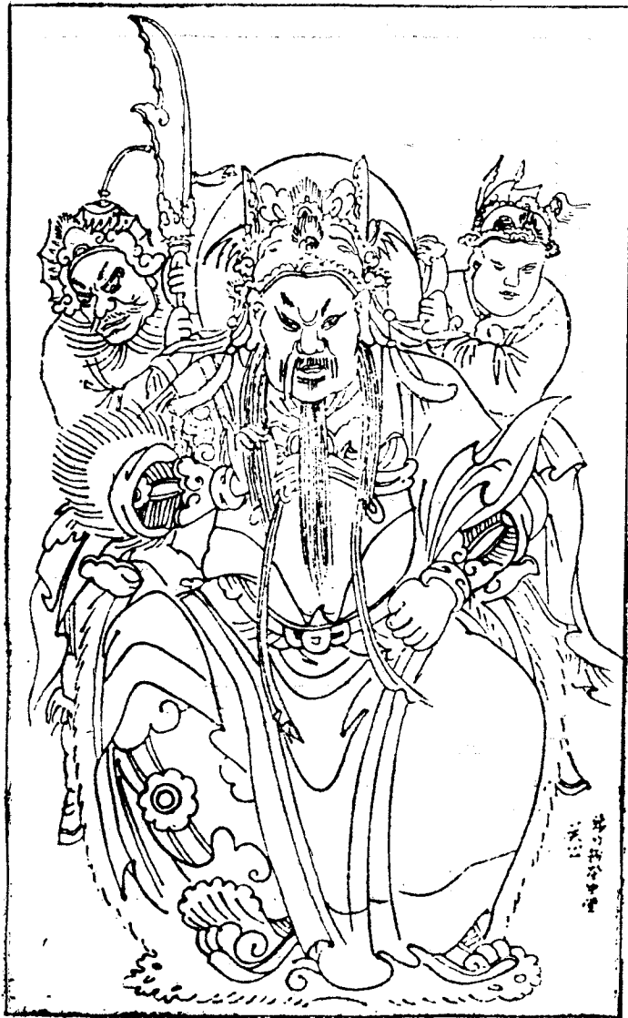
关公像（四川绵竹年画）