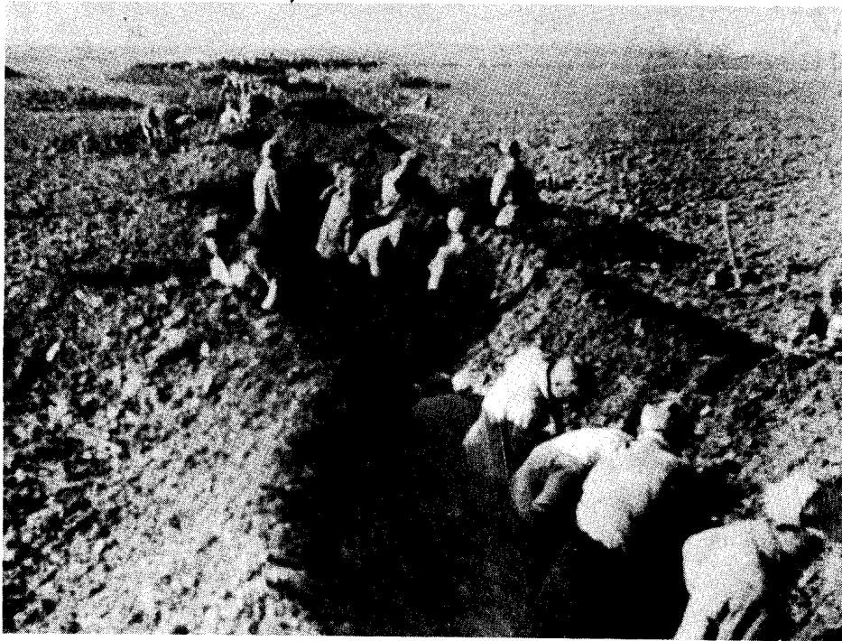
中野某部挖战壕，准备总攻黄维兵团。