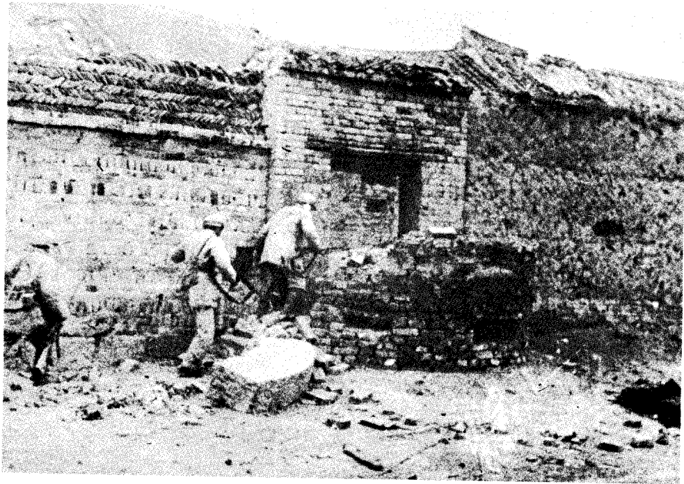
华野某部攻占碾庄圩黄百韬兵团部。