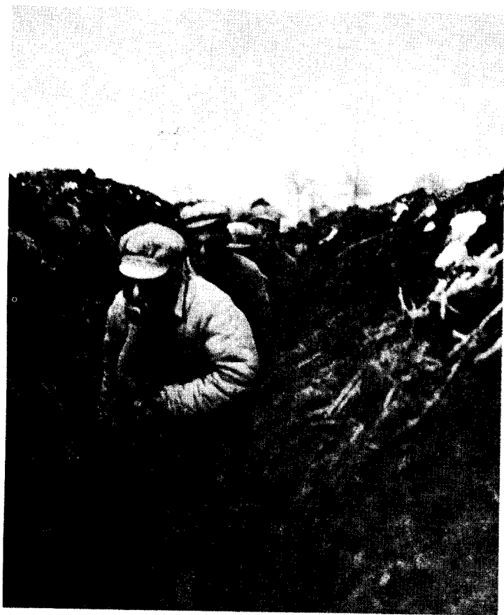
黄维兵团施放毒气，中野某部战士戴防毒面具作战。