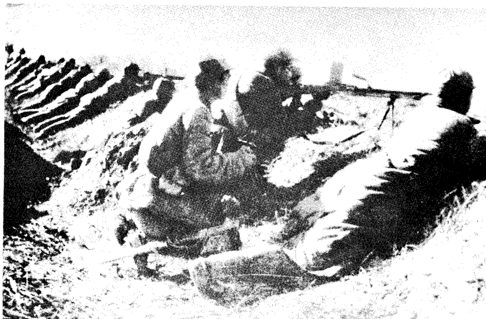
中野将黄维兵团包围在双堆集地区，这是包围阵地之一角。