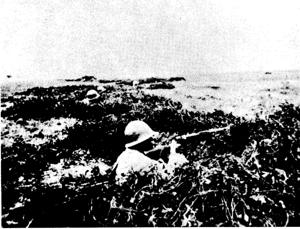
中野某部阻击自豫南来援的黄维兵团。