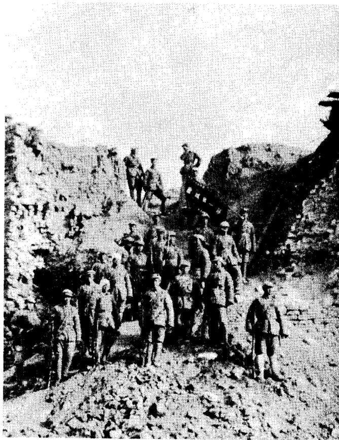
中野某部8连突破宿县西门,荣获“登城第一名”称号。