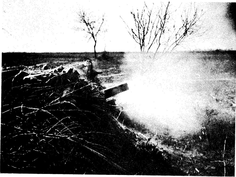
我炮兵向碾庄圩守敌猛轰。