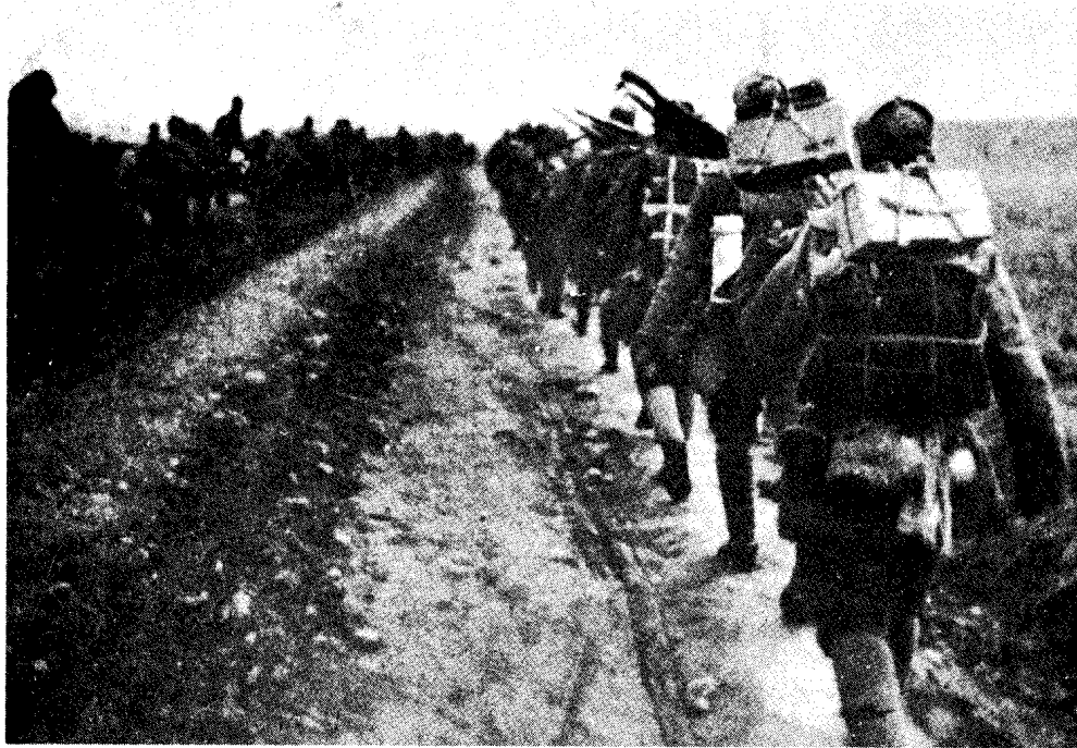
华野主力向淮海战场进军。