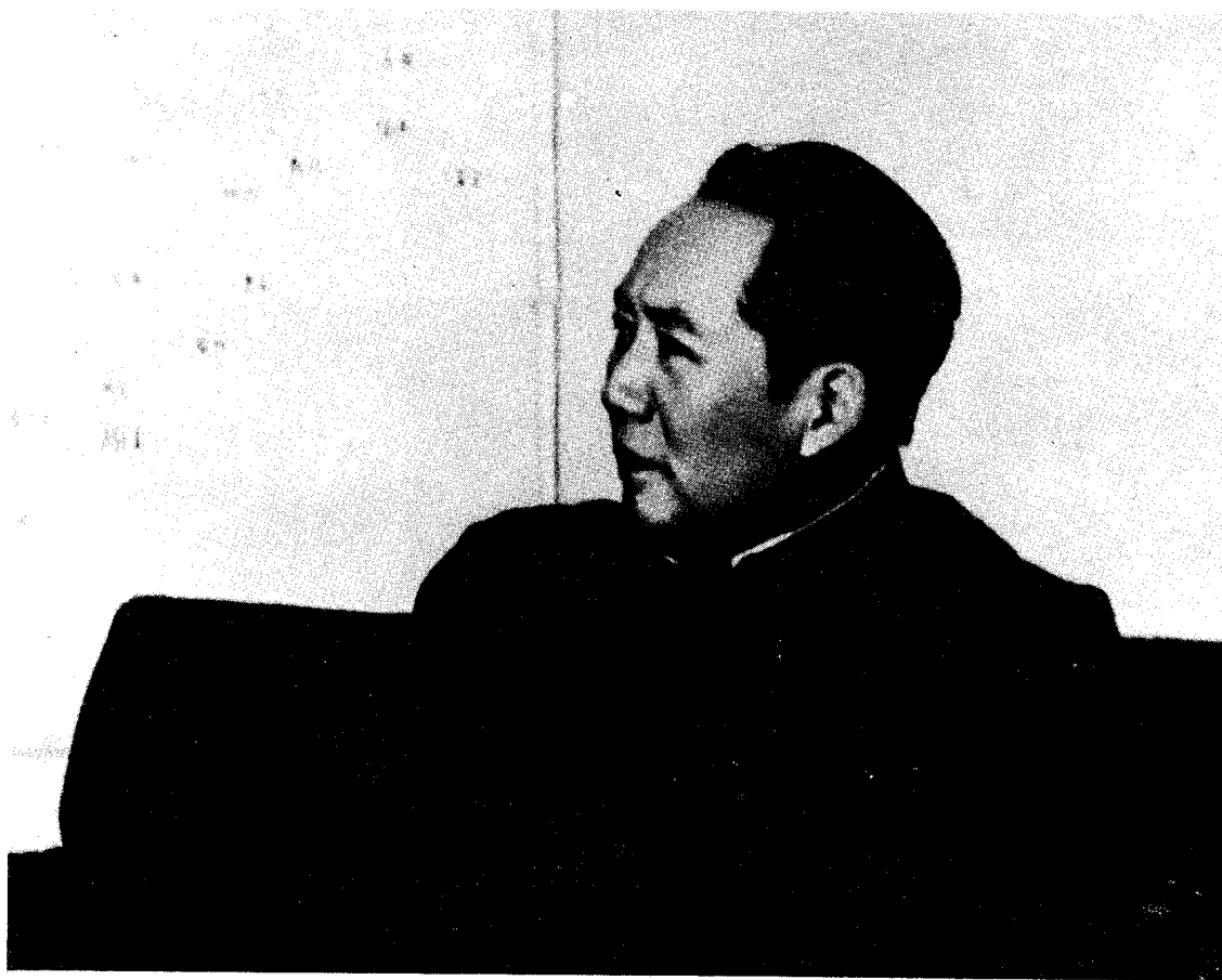
中共中央主席、中央军委主席毛泽东在河北省平山县西柏坡。