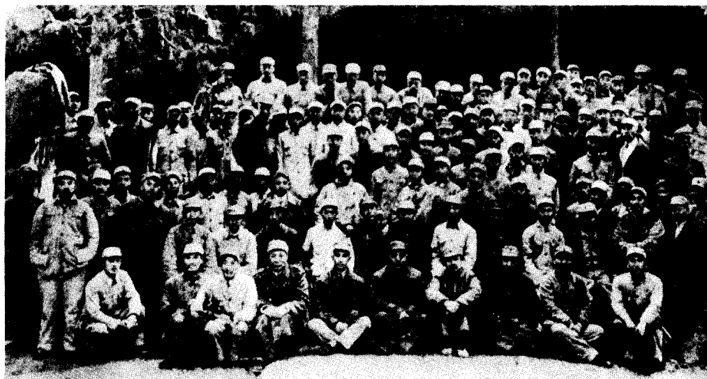
1948年10月，华东野战军前委召开曲阜会议，传达中央政治局九月会议精神，研究制订淮海战役作战方案。图为曲阜会议全体人员合影。