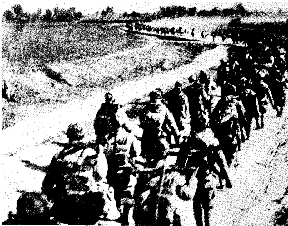
中野主力向淮海战场进军。