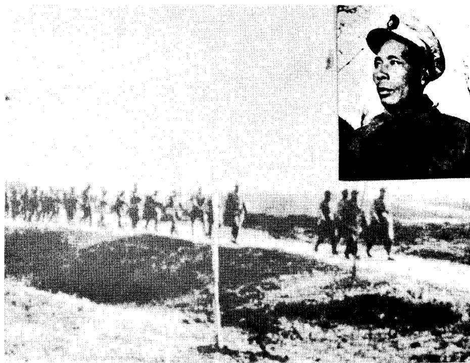
黄维兵团第85军110师师长廖运周（右上）率部起义开赴解放区。