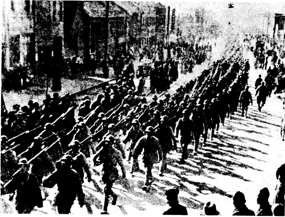
人民解放军解放徐州城。