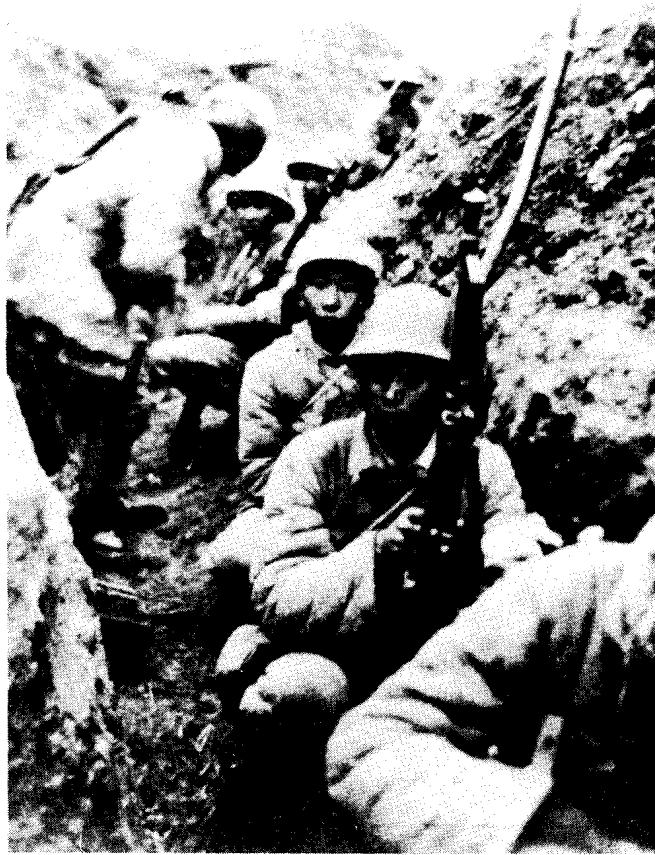
中野某部指挥员向突击队员交待任务。