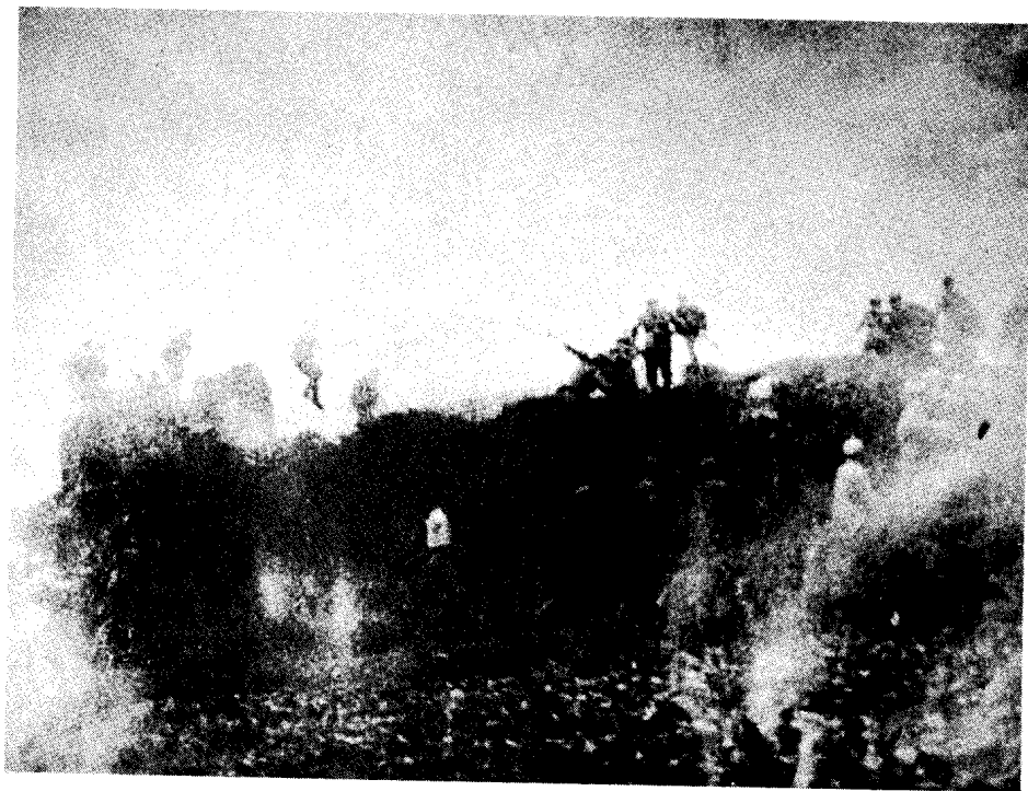
中野第6纵队、华野第7纵队紧密配合，攻战双堆集东南制高点尖谷堆。