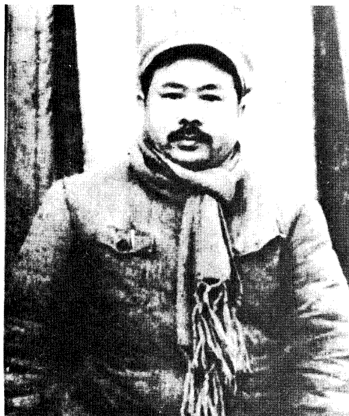
中共中央书记处书记任弼时 在西柏坡。