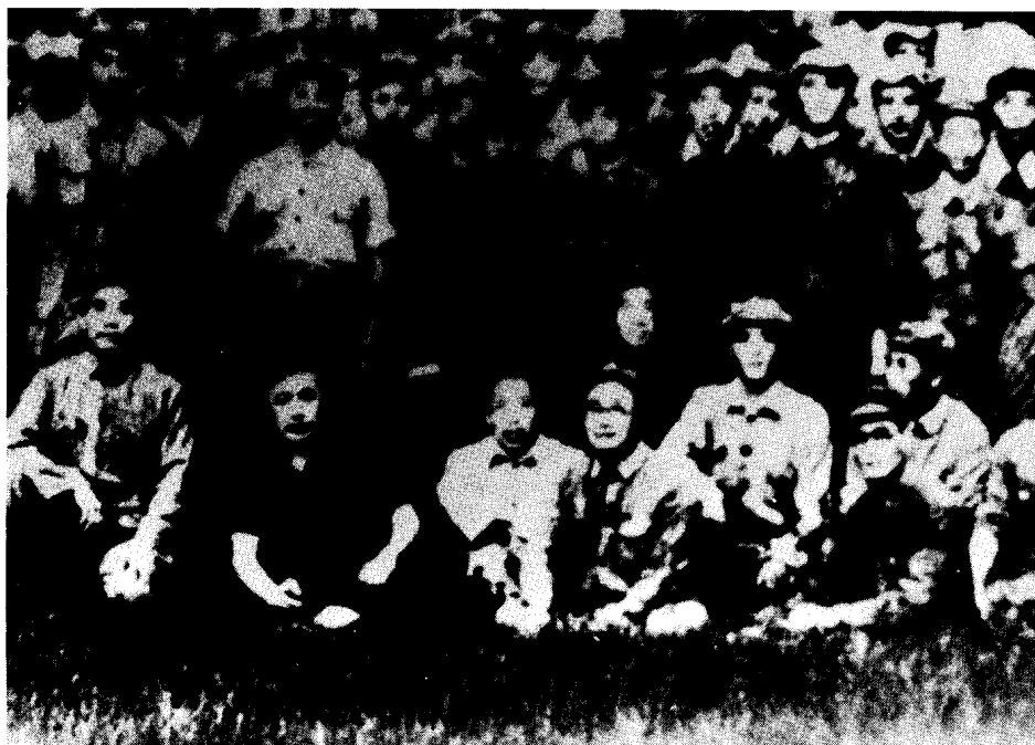
1948年初秋，中原局、中原军区召开宝丰会议，进行整党整军，为对敌展开更大攻势，从思想上、组织上作了准备。图为宝丰会议全体人员合影。