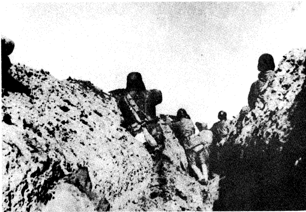
华野某部徐东阻击阵地一角。