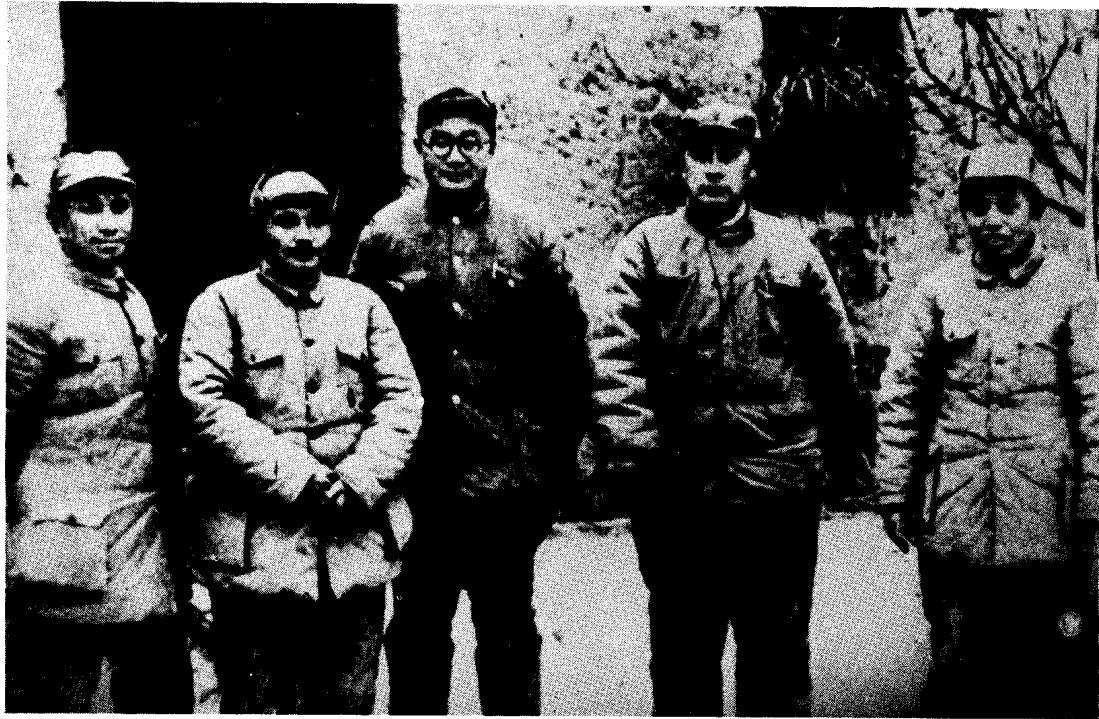
淮海战役总前委成员（左起）粟裕、邓小平、刘伯承、陈毅、谭震林。