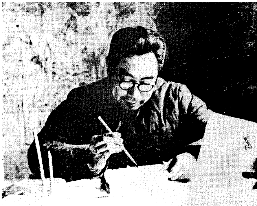
西柏坡。 中共中央书记处书记、军委副主席周恩来在