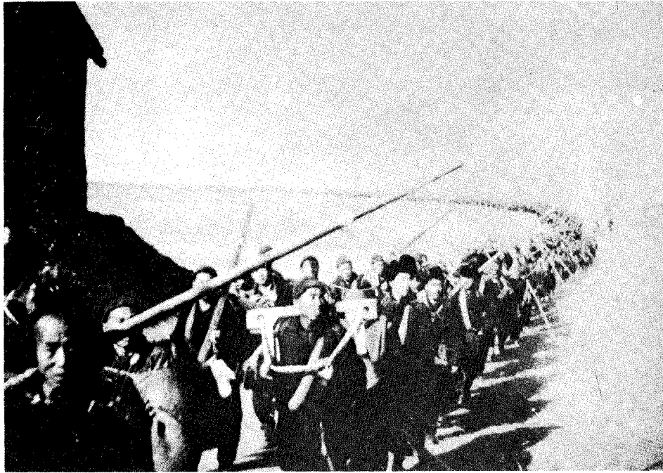
解放区人民组成支前大军开赴前线支援人民解放军作战。