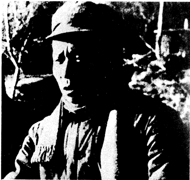
西柏坡。 中共中央书记处书记、军委副主席刘少奇在