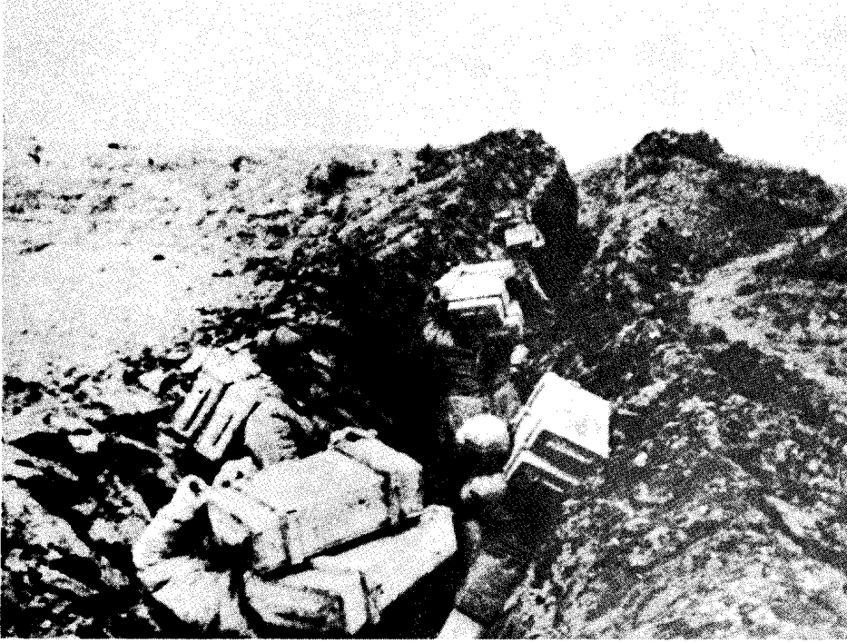
人民解放军后勤人员向阵地运送弹药。