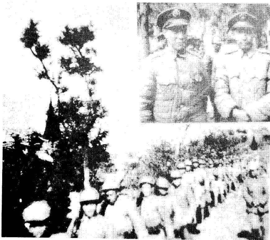
第3绥靖区副司令官何基沣(右上左)、张克侠(右上右)率部起义,开赴解放区。