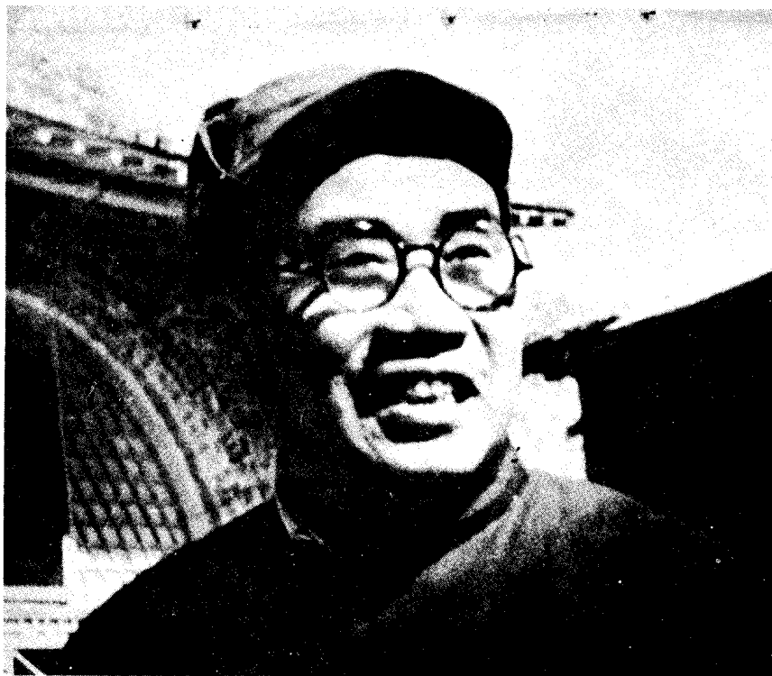
中共中央书记处书记、军委副主席朱德在西柏坡。