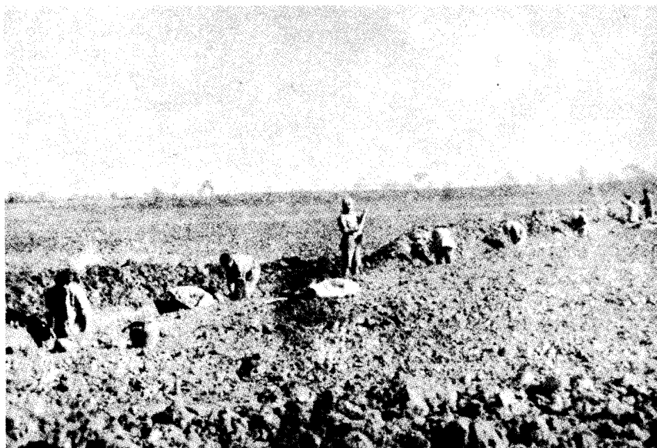
南援。 华野在徐州以南构筑工事，阻击徐州国民党军