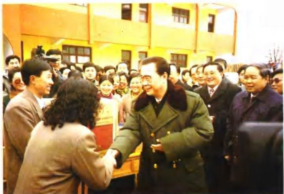
1996年春节,李鹏总理在延安期间,视察杨家岭希望小学,并赠送学校一台彩电。