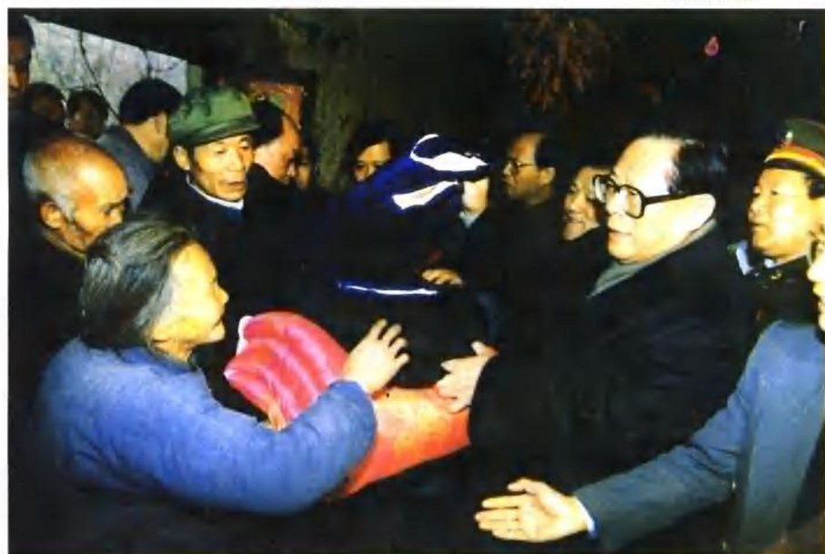
1995年12月22日,江泽民总书记在商洛慰问群众时,在丹凤县白衣寺村向贫困户赠送棉衣棉被。