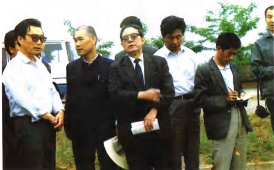
1991年,国务委员,国家科委主任宋健在陕北老区考察科技扶贫工作,左三为宋健同志。