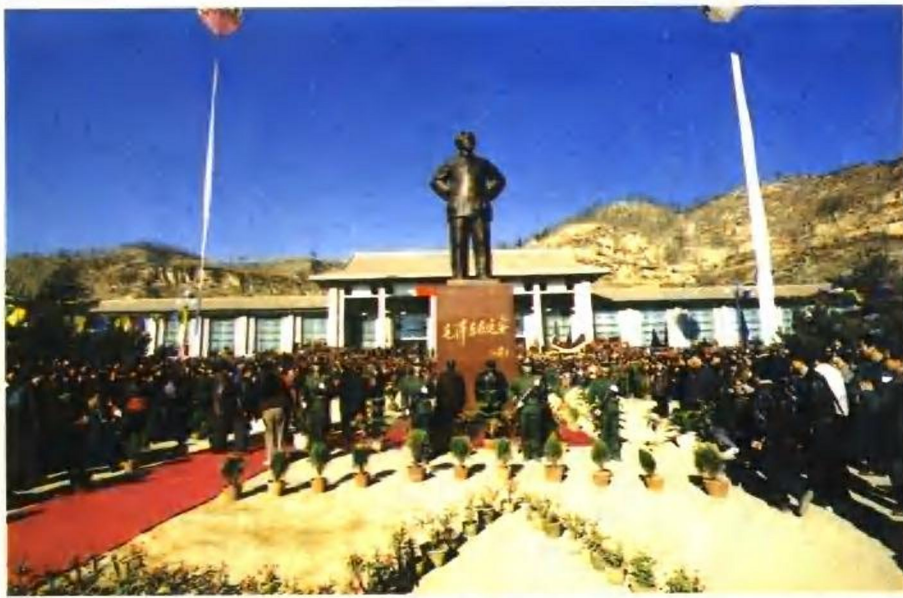
延安人民在延安革命纪念馆前举行毛泽东铜像揭幕仪式