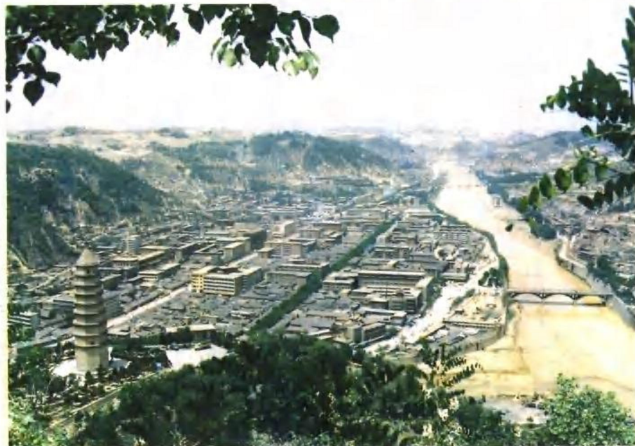
欣欣向荣的延安城市新貌