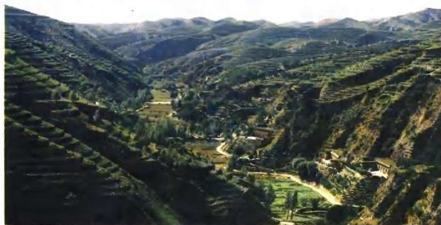
米脂县对岔小流域综合治理