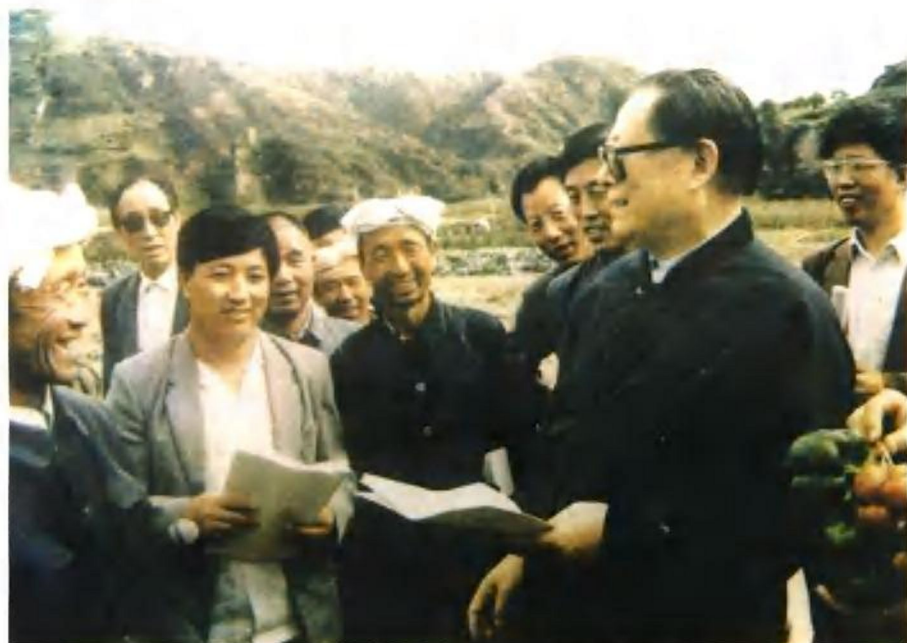
1989年9月9日,江泽民总书记在延安视察时,和延安市(今宝塔区)领导、万花乡农民亲切交谈。