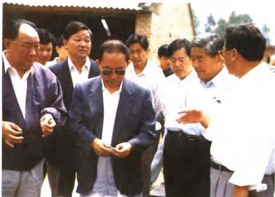
1997年6月21日,国务委员、国务院扶贫领导小组组长陈俊生在蓝田考察扶贫工作。前排左二为陈俊生同志。