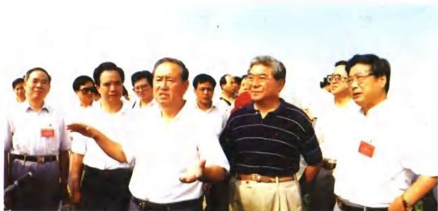
1997年8月,姜春云副总理在陕北参加全国治理水土流失、建设生态农业现场经验交流会期间,在米脂县视察。前排右三为姜春云同志。