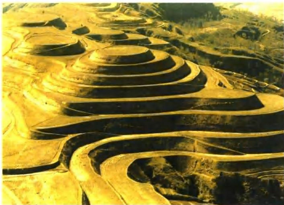
延安市宝塔区世行贷款项目延河流域治理芦草沟治理区的高标准梯田