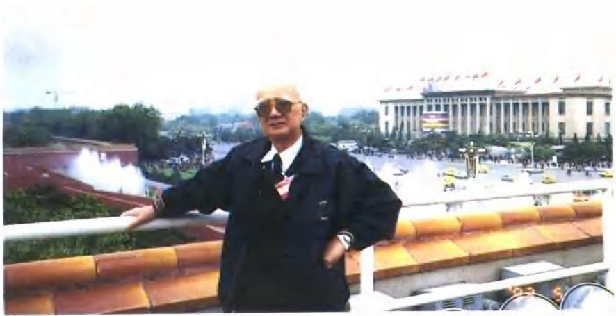
邓子基教授作为“福建省‘五一’奖章”获得者登上天安门(1993年)