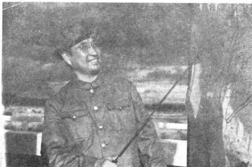
解放战争时期的陈赓同志

渡江作戰，完成歷史 任務。對此壯舉，不能忘記。 決心寫下去。特錄。 陳赓 三十、九、初前夜。 於溧水之梅巷大橋。