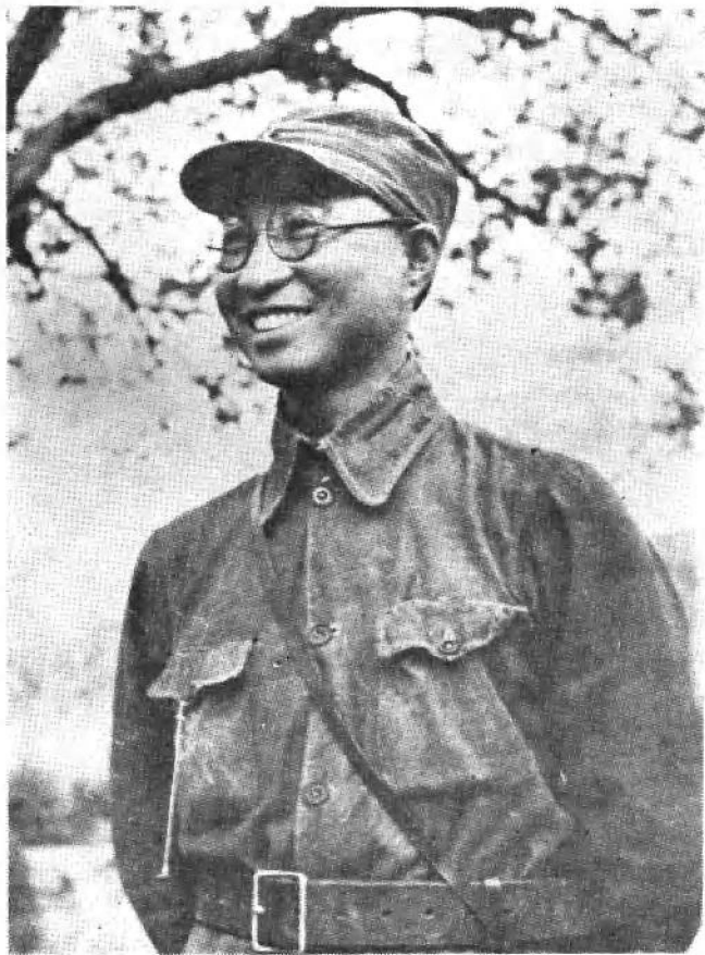
抗日战争时期的陈赓同志