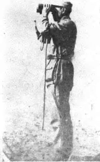
陈赓同志在抗日战场上