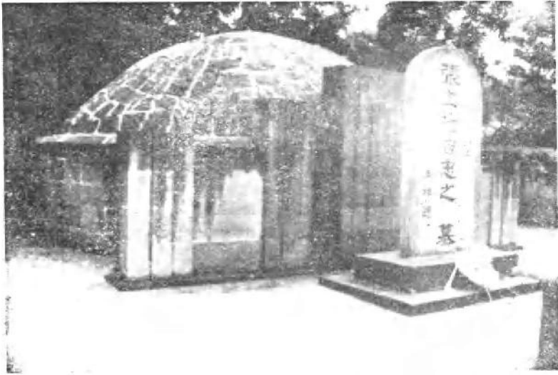
位于四川北碚梅花山的张自忠将军之墓