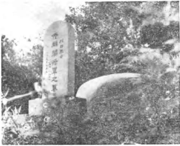
位于北京 香兰涧的佟麟 阁将军之墓