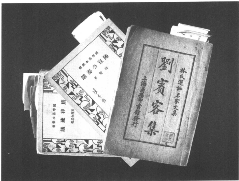
陳寅恪批校之劉賓客集、陸宣公奏議、唐律疏議