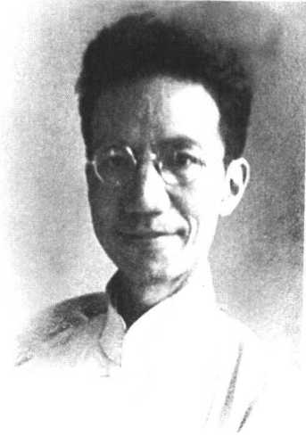
一九三九年暑假於香港