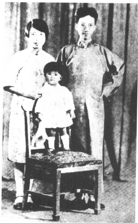
陳寅恪夫婦與長女流求（周歲）攝 於北平 一九三〇年