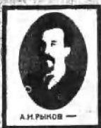
А. Н. РЫКОВ