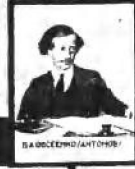
Б. С. ЕДИНБУРГСКИЙ