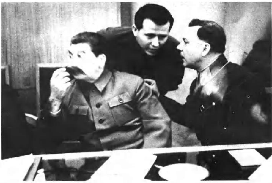
“领袖”听到了新闻。自左至右：斯大林、叶若夫、伏罗希洛夫（1935年）。