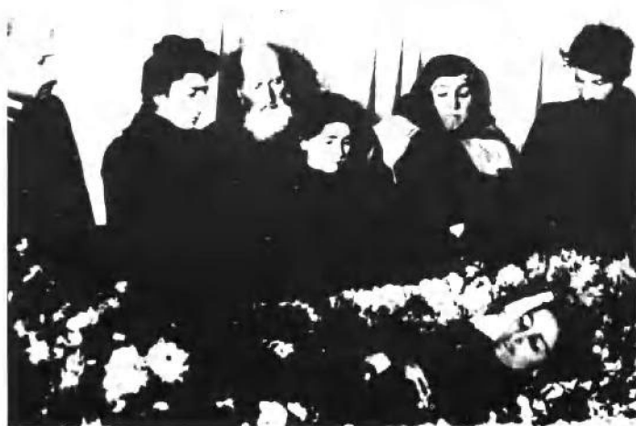
叶·斯瓦尼泽 的葬礼。右一是斯 大林（1908年）。