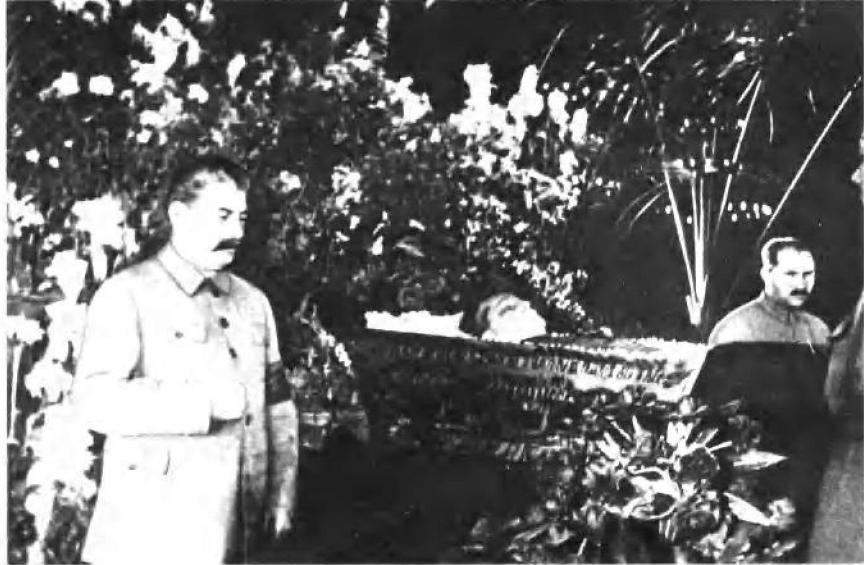
斯大林和卡冈诺维奇在基洛夫遗体旁守灵（1934年）。