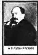
А. В. ЛУНАЧАРСКИЙ