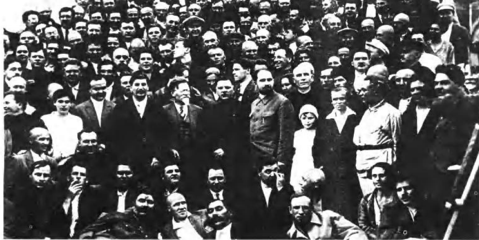
莫洛托夫（站立的第一排左起第三人）、斯大林（左起第四人）、伏罗希洛夫（左起第六人）、卡冈诺维奇（左起第七人）同联共（布）第十七次代表大会的代表在一起（1934年）。