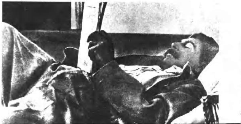
总书记需要读 更多的东西。在别 墅里。