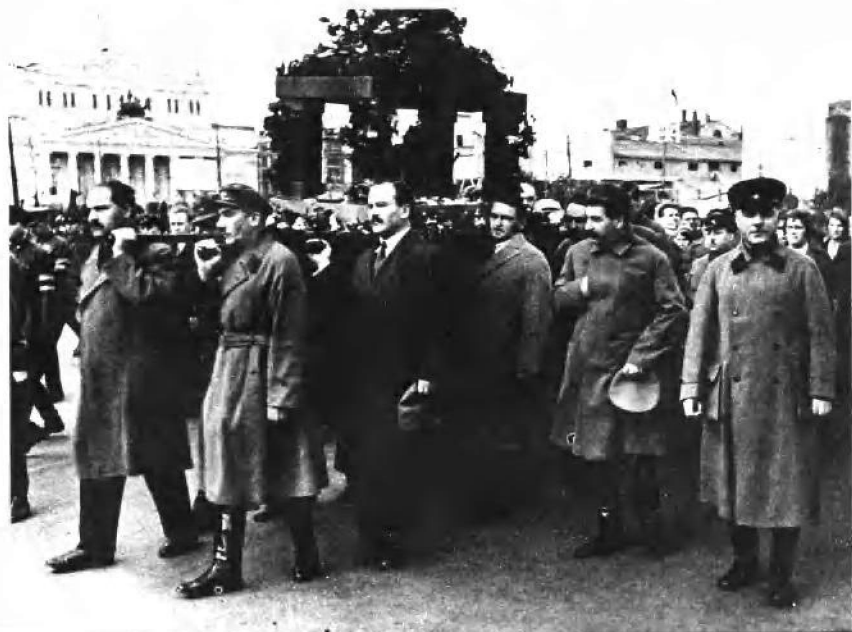
在明仁斯基的葬礼上。自左至右：卡冈诺维奇、雅哥达、莫洛托夫、米高扬、斯大林、伏罗希洛夫（1934年）。