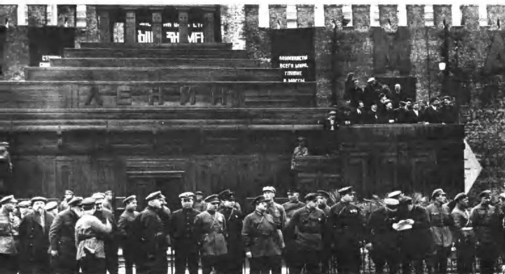
1925年5月1日。莫斯科红场。列宁墓旁。前排自左至右：柯恩、叶努基泽、谢佳金、穆克列维奇、伏罗希洛夫、布勃诺夫、温什利赫特、巴拉诺夫、图哈切夫斯基、叶戈罗夫、布琼尼。