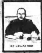
Н. В. КРЫЛЕНКО