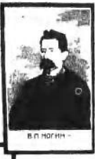
В. П. НОГИН