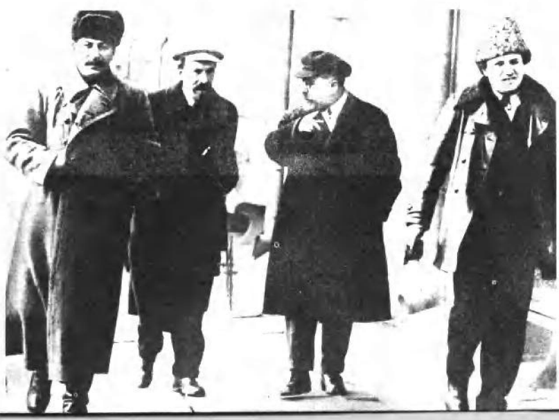
暂时还在一起。（自左至右）斯大林、李可夫、加米涅夫、季诺维也夫（20年代初）。