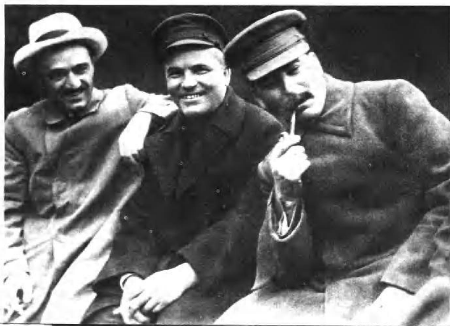
不同命运的人：（自右至左）斯大林、基洛夫、米高扬（1932年）。