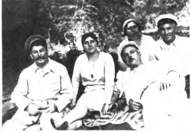
在大自然的怀抱里。 (自左至右) 斯大林夫妇 和伏罗希洛夫夫妇 (1927 年)。