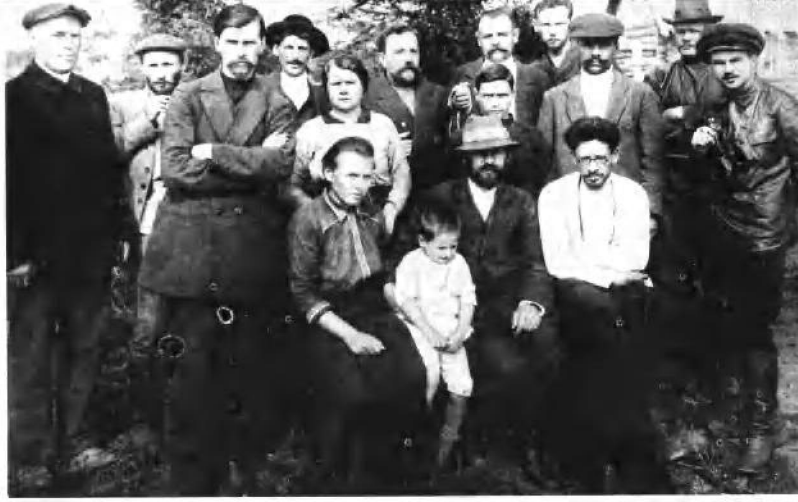
修道院村 (1915年)。一批流放者中的中央委员：加米涅夫(后排右起第四人)、斯维尔德洛夫(前排右起第一人)、斯大林(后排左起第三人)、彼得罗夫斯基(前排右起第二人)。