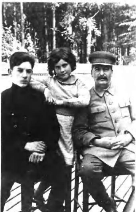
斯大林同儿子瓦西里和女儿 斯维特兰娜。