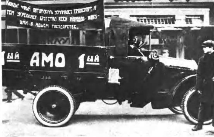
这是苏联的第一辆汽车(20年代)。