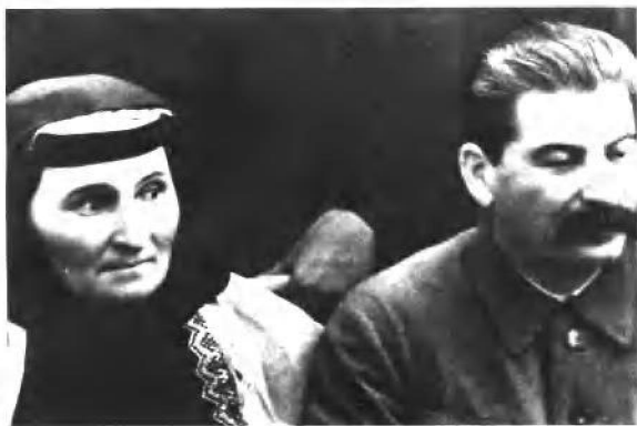
斯大林和母亲 叶卡捷琳娜·朱加 施维里（1935年）。