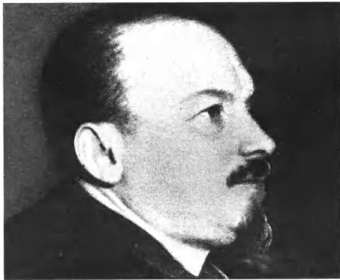
“党的宠儿”布哈林受审（1938年）。