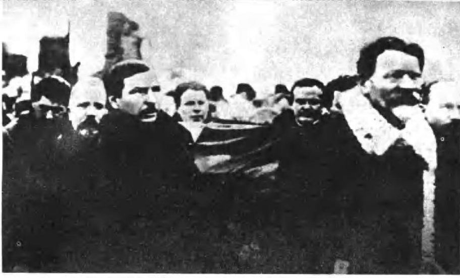
列宁的葬礼。自右至左：布哈林（右一）、加里宁（右二）、季诺维也夫（右三）、莫洛托夫（右四）、鲁祖塔克（左四）、托姆茨基（左三）、加米涅夫（左二）、斯大林（左一）。