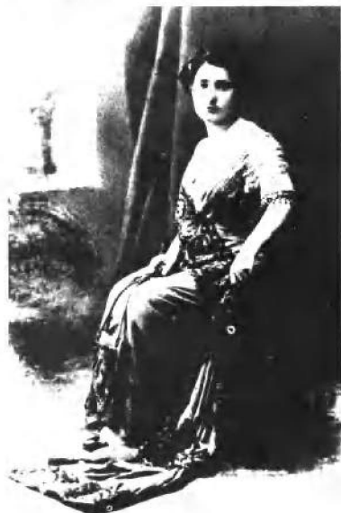
叶卡捷琳娜（卡托） 斯瓦尼泽——斯大林的 第一个妻子。