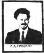
Л. Д. ТРОЦКИЙ