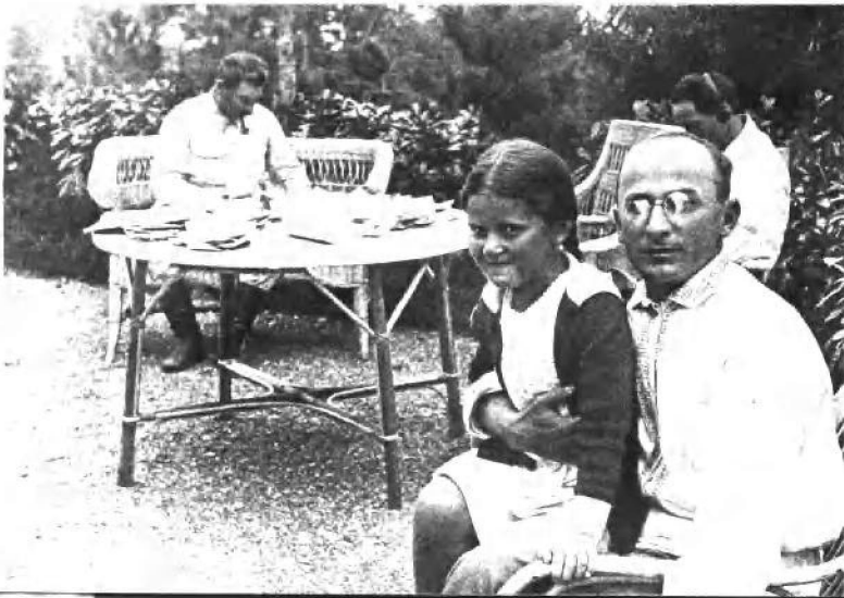
斯大林、贝利亚 和斯大林的女儿在别 墅里。