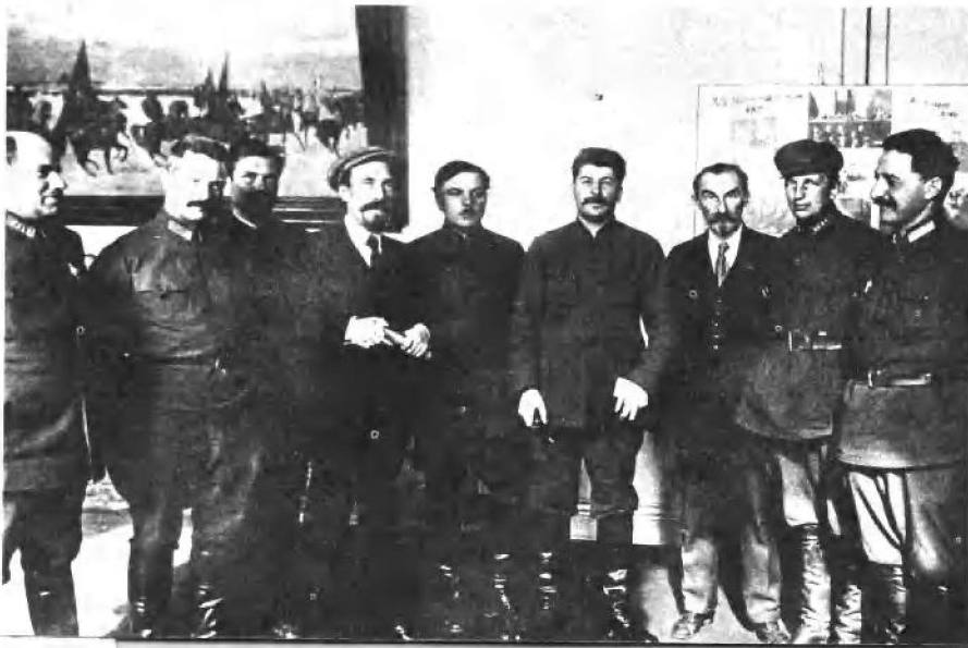
暂时还是战友。第十六次党代表会议的代表：（自左至右）拉舍维奇、伏龙芝、斯米尔诺夫、李可夫、伏罗希洛夫、斯大林、斯克雷普尼克、布勃诺夫、奥尔忠尼启泽（1925年）。