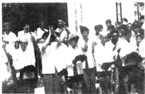
1993年桃源县枫树乡维吾尔族回族群众庆祝清真寺落成