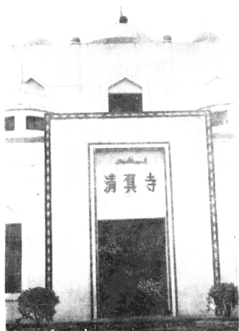
桃洲县柯利维吉尔乡清真寺