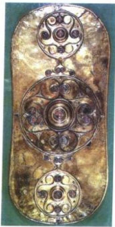
塞尔特文物：巴塔西之盾

至公元5世纪中叶，今日易北河口一带的盎格鲁-撒克逊人大举进攻不列颠，罗马人被逐回欧陆，凯尔特人则被征服。他们大肆破坏，造成大约两百年缺乏历史记载的黑暗时代，英格兰之名从此开始。随后历经7、8两世纪，撒克逊各民族逐渐形成七个王国，互争雄长。然后随着基督教的传布，撒克