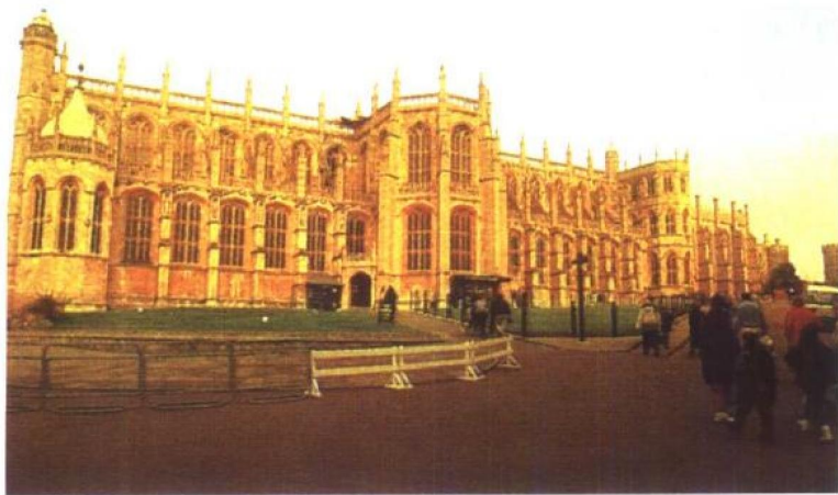
温莎堡内的圣乔治礼拜堂

英格兰银行的勘测员索恩在为银行新总部大楼所做的设计里(1788年)，把古希腊的女柱像、罗马的浴室视窗和拜占庭穹宇上的圆顶结合起来，这反映出了全欧洲对古典文