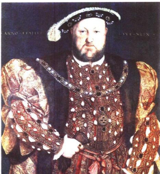
贺尔拜因《亨利八世》，现藏意大利罗马国家画廊

宗教问题与英国君权神授的思想有深远的关系。亨利八世因写过一篇攻击路德思想的文章而被教皇授予“正统宗教维护者”的称号，可是当教皇不同意他与元配凯瑟琳离婚的时候，他便拒绝承认教皇的权威，并自封为英国教会的最高元首。在改革英国国教后，他开始没收教会的财产，通过解散修道院获得了巨额资金，供他修筑其宫殿，建造八处新的皇家住宅，包括堂皇无比的诺内苏什宫(现已毁)。汉普