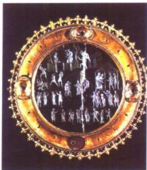
罗塔尔的水晶， 基督教文化遗 物，上刻《圣经》 故事

英王在封建法规下领有法国西半部的土地，因此酝酿了两国的纷争，进而导致14、15世纪的百年战争。此外，被诺曼人征服的英国，其文化倾向法国文化，英语不及法语重要，而文学艺术也缺乏民族特色。但到了百年战争期间，这种情形有了改变，英人已较从前更具自己独特的文化性格