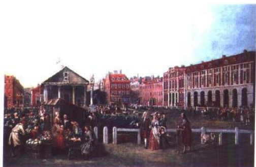
18世纪英国平民生活图

都铎王朝末期伊丽莎白女王时代，则打败了威胁英国的西班牙无敌舰队，使海上发展的能力受到肯定。17世纪斯图亚特王朝时期，王室与中产阶级互争权