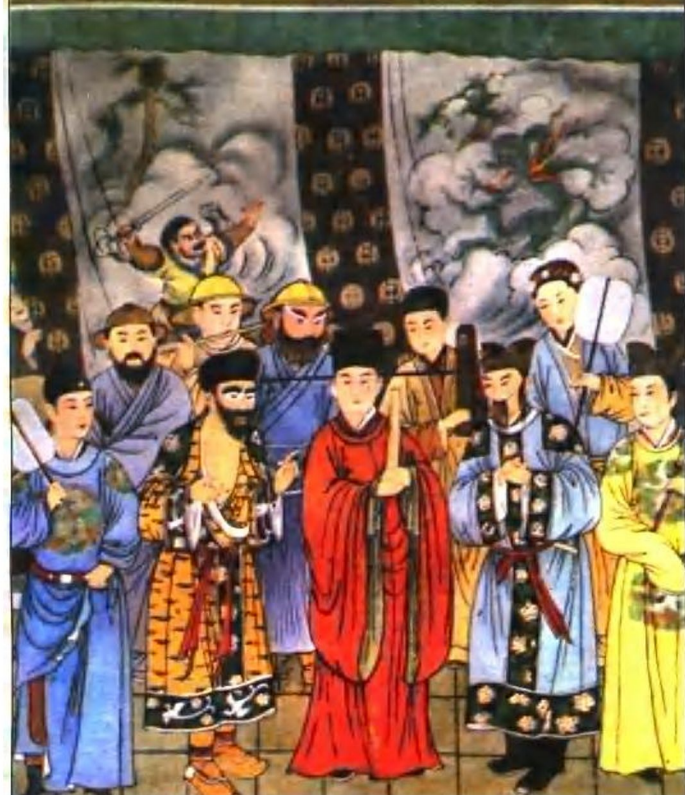
山西洪洞元代杂剧壁画