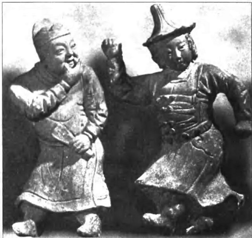
焦作出土元代舞俑