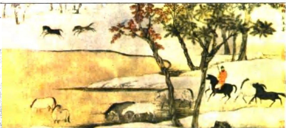
赵孟頫：秋郊饮马图