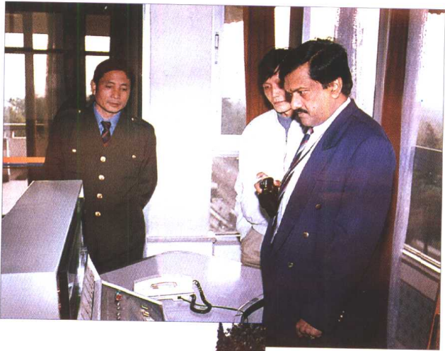
联合国官员考察 施桥船闸