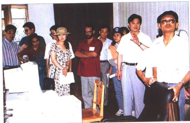
联合国亚太经社八 国代表参观施桥船 闸