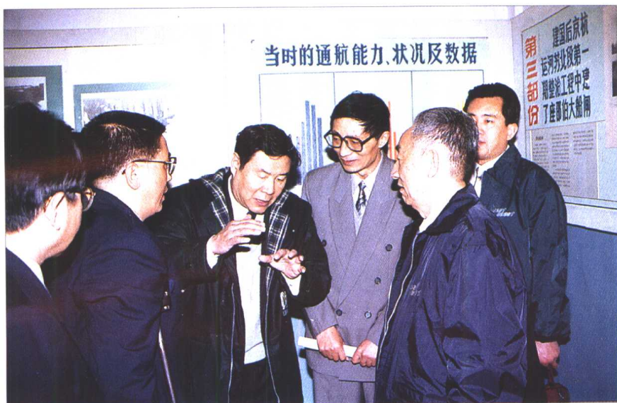
1997年国务院副总理邹家华、江苏省省长郑斯林等领导视察邵伯船闸