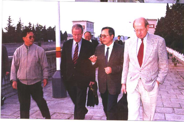
联邦德国交通部 专家考察邵伯船 闸