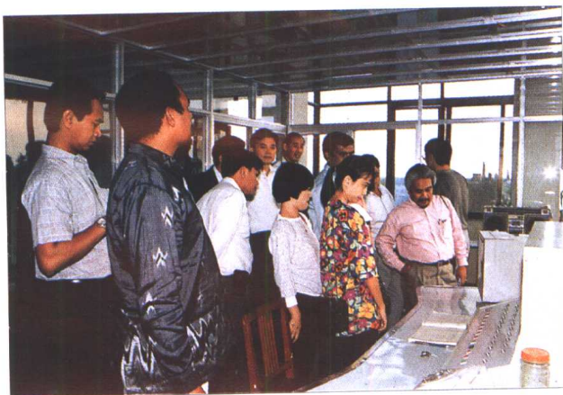
世界银行官员考 察施桥船闸