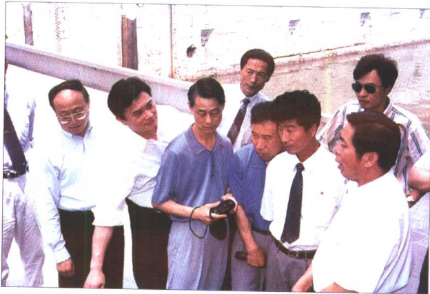
朝鲜代表团参观施 桥船闸