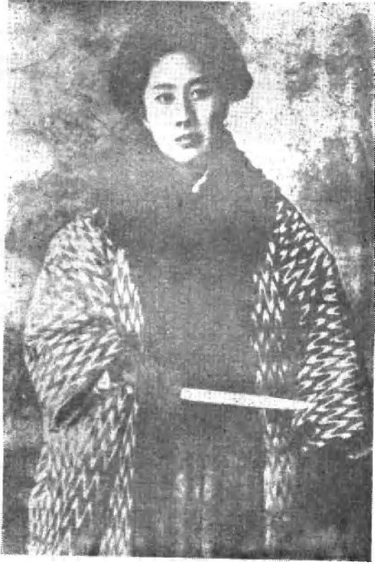
秋 瑾 像