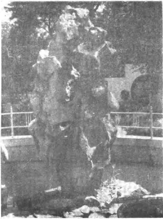
牡丹石 吕留良祖居友芳园遗物 现存桐乡县崇福镇中山公园内