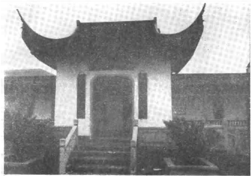
吕晚村先生纪念亭，1989年吕留良诞辰360周年时重建。