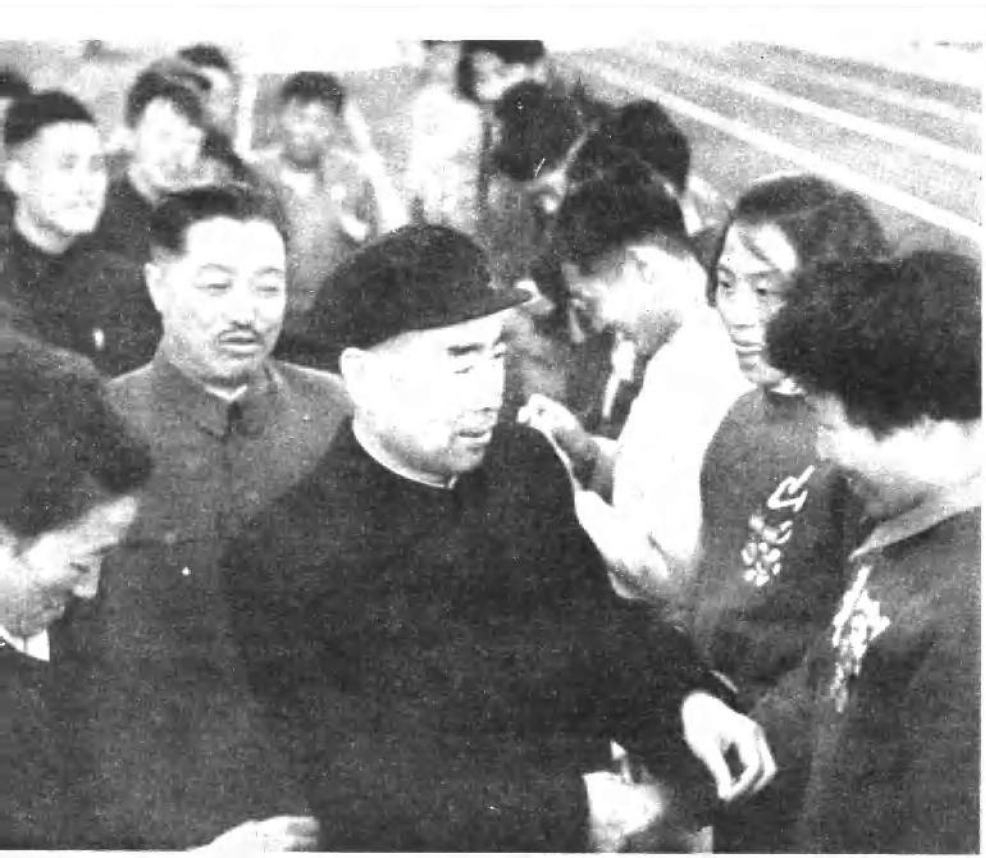
一九六五年，贺龙同志陪同周恩来同志给运动员发奖。