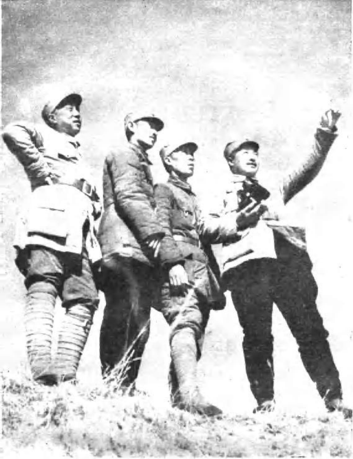
一九三八年，贺龙同志和周士第、关向应、甘泗淇同志 (自右至左)在雁门关前线视察。