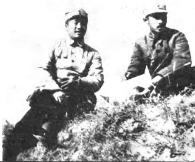
一九三九年在 陈庄战斗中，贺龙 同志和关向应同志 在前线察看地形。