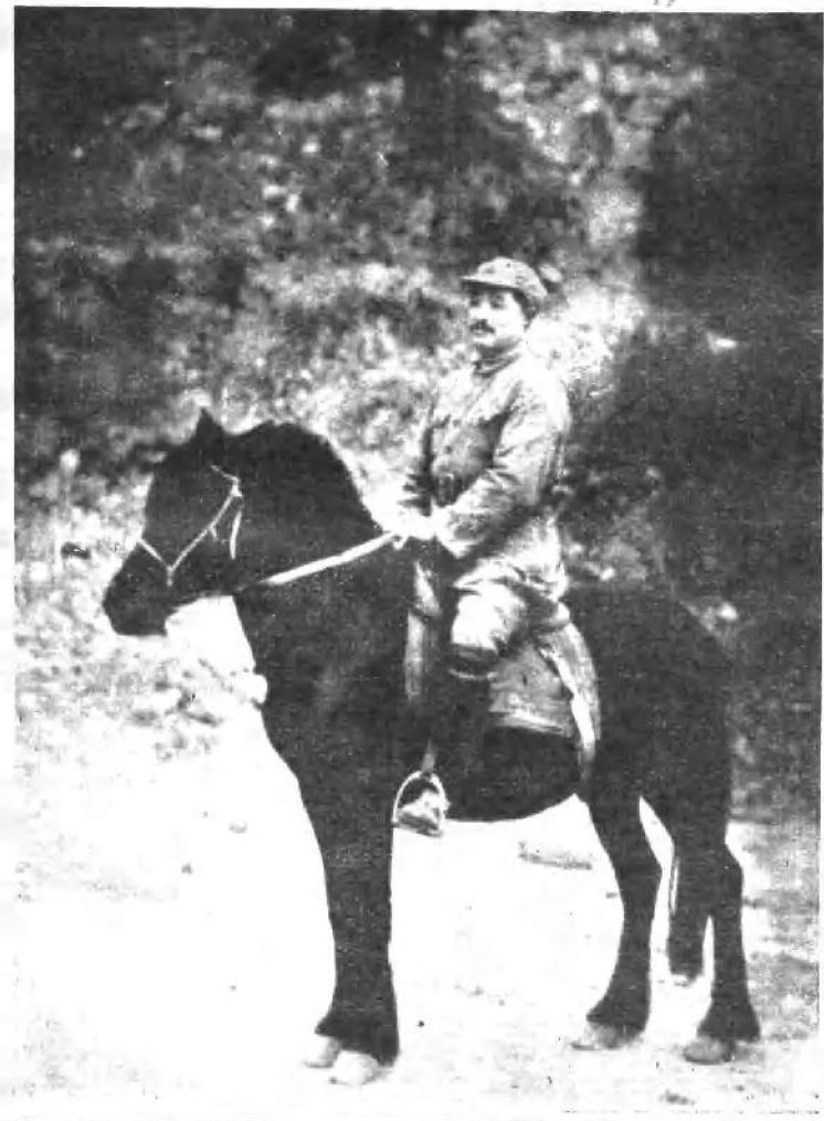
一九三七年春， 贺龙同志在庄里 镇。