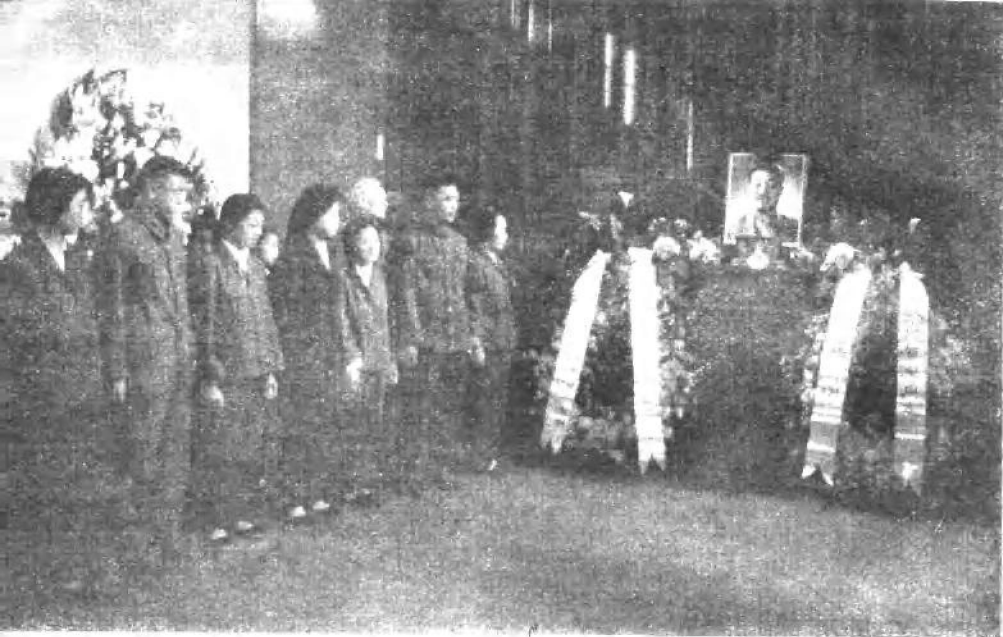
一九七五年六月九日，在八宝山举行贺龙同志骨灰安放仪式。