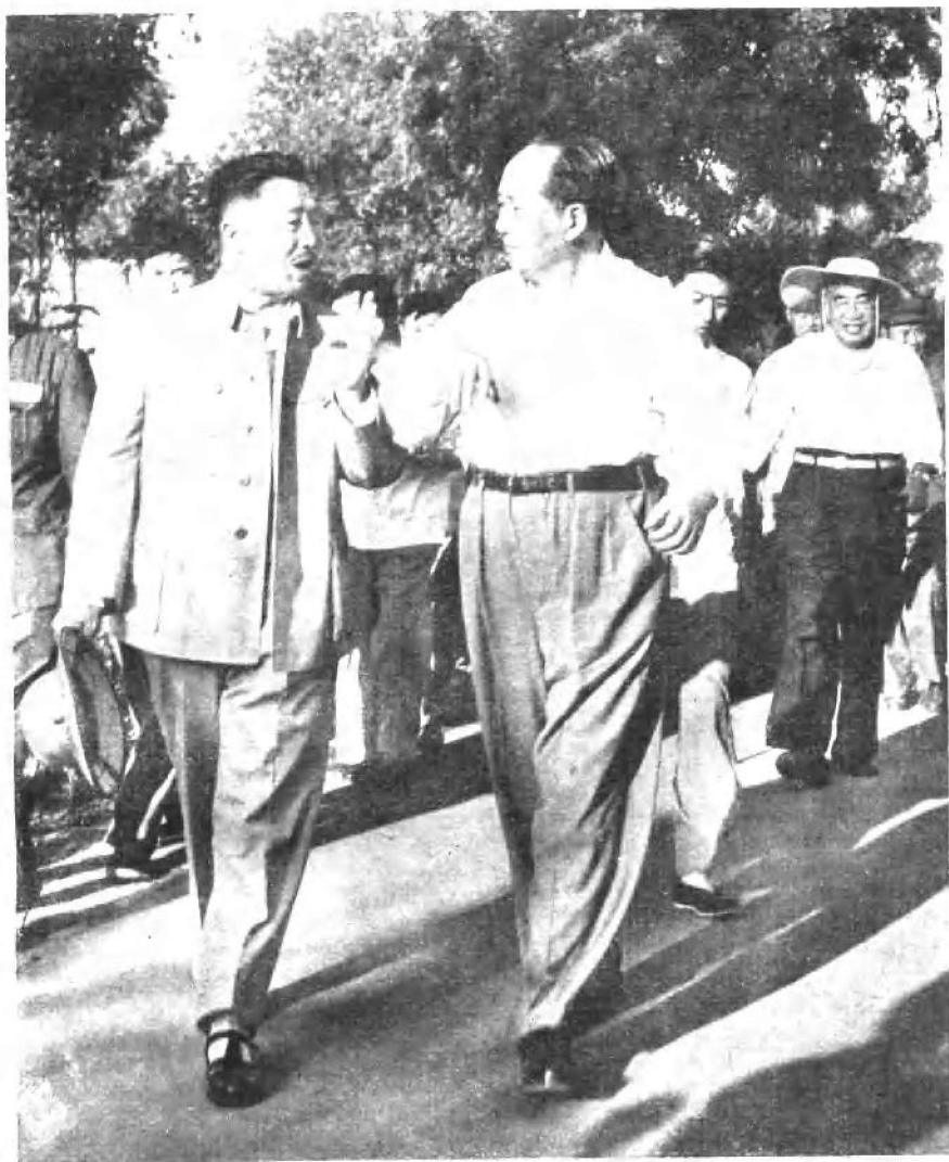
一九六四年，贺龙同志陪同毛泽东同志、朱德同志 观看军事演习。