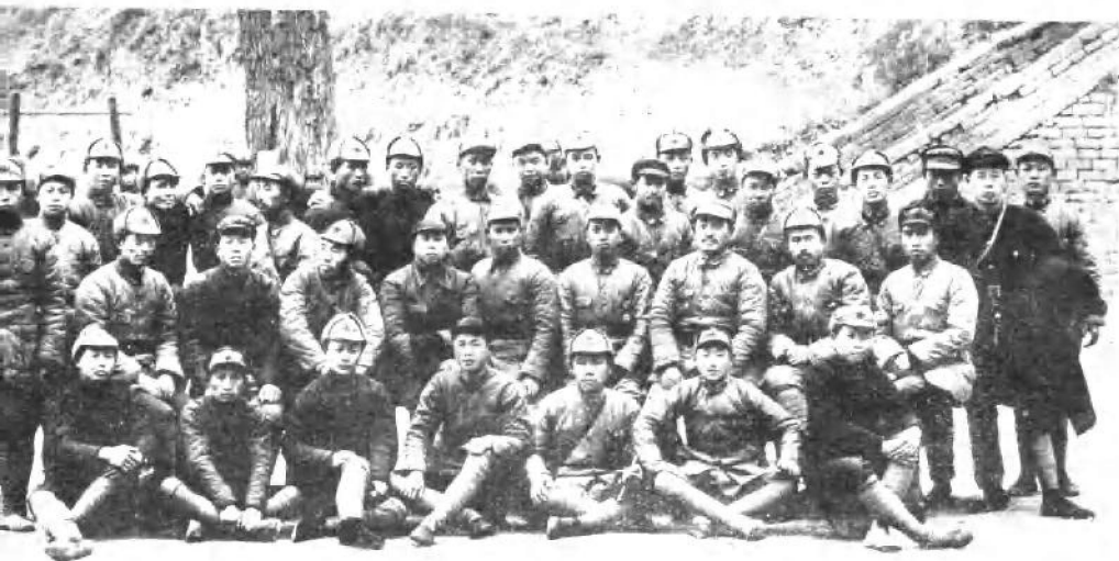
长征到达陕北后，一九三七年贺龙同志和红二方面军部分团以上干部在陕西省耀县陈炉镇合影。