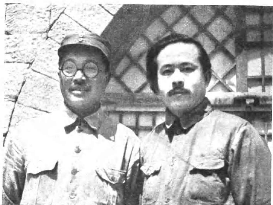
抗日战争时期，贺龙同志和任弼时同志在延安。