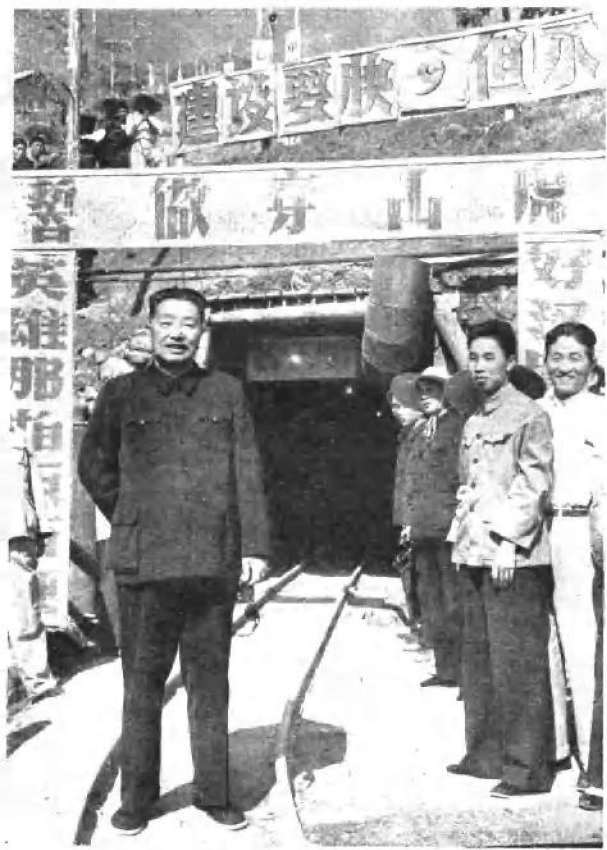
一九六六年，贺龙同志视察工业战线，右一为程子华同志。