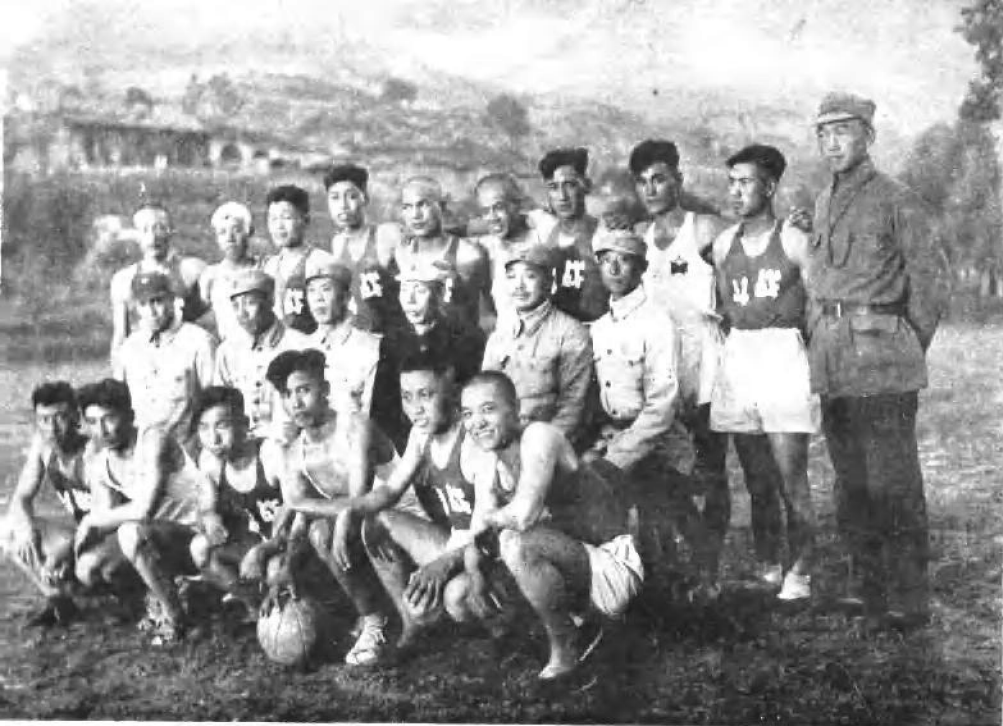
一九四〇年，贺龙同志和东干篮球队(背心无字的)、 战斗篮球队合影。