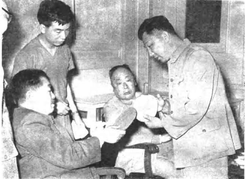
一九六一年，第二十六届世界乒乓球锦标赛在北京举行时，贺龙同志和陈毅同志观看红双喜球拍，右一为荣高棠同志。