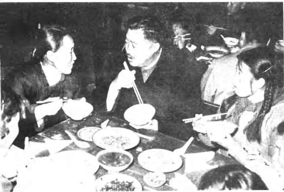
一九五八年，贺龙同志陪同朝鲜政府代表团参观湖北应城红旗公社时，与社员一起用饭、交谈。