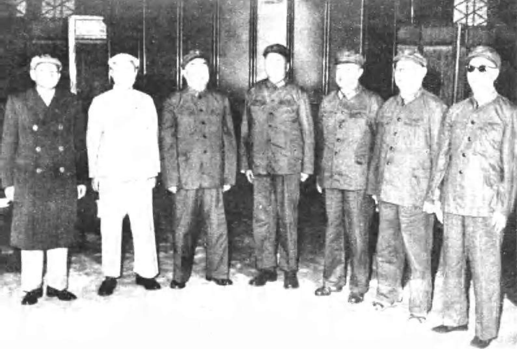
一九六六年，毛泽东同志、朱德同志和贺龙、叶剑英、徐向前、邓子恢、陈云同志在北京。