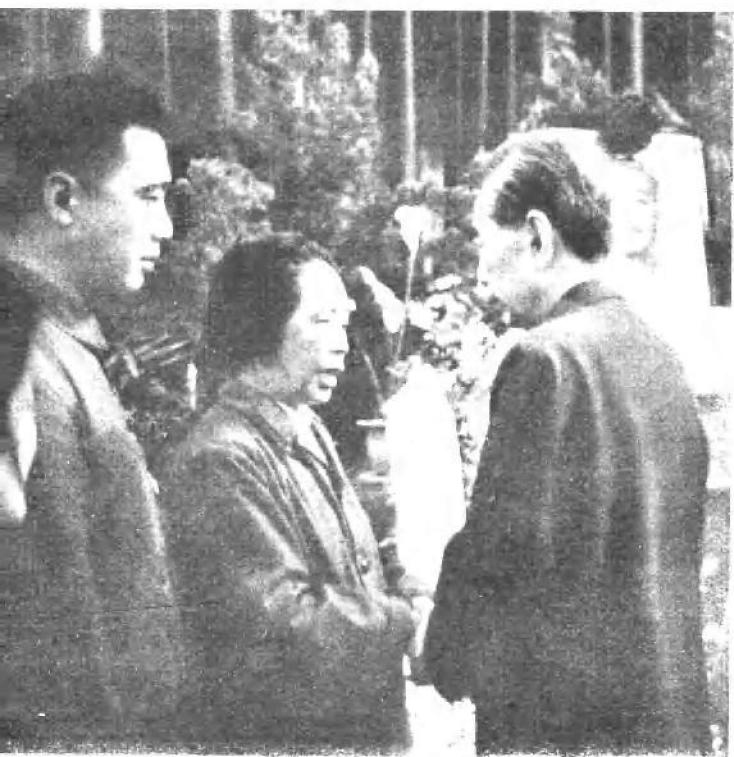
在贺龙同志骨灰安放仪式上，马思聪同志代表党中央和毛泽东同志向贺龙同志的夫人薛明同志及其子女致以亲切慰问。