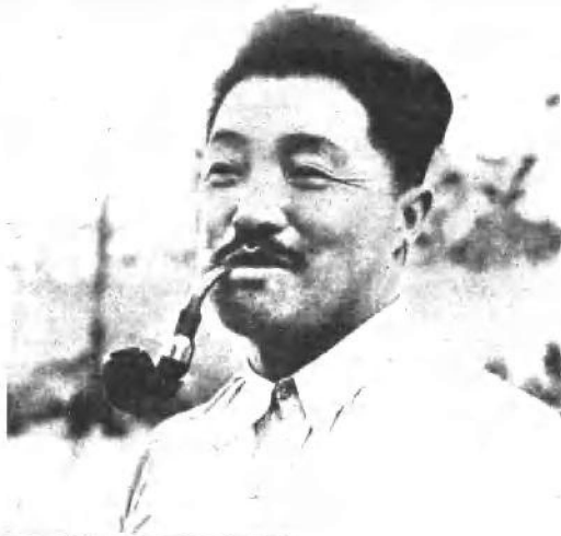
一九四四年，贺龙同志在延安。