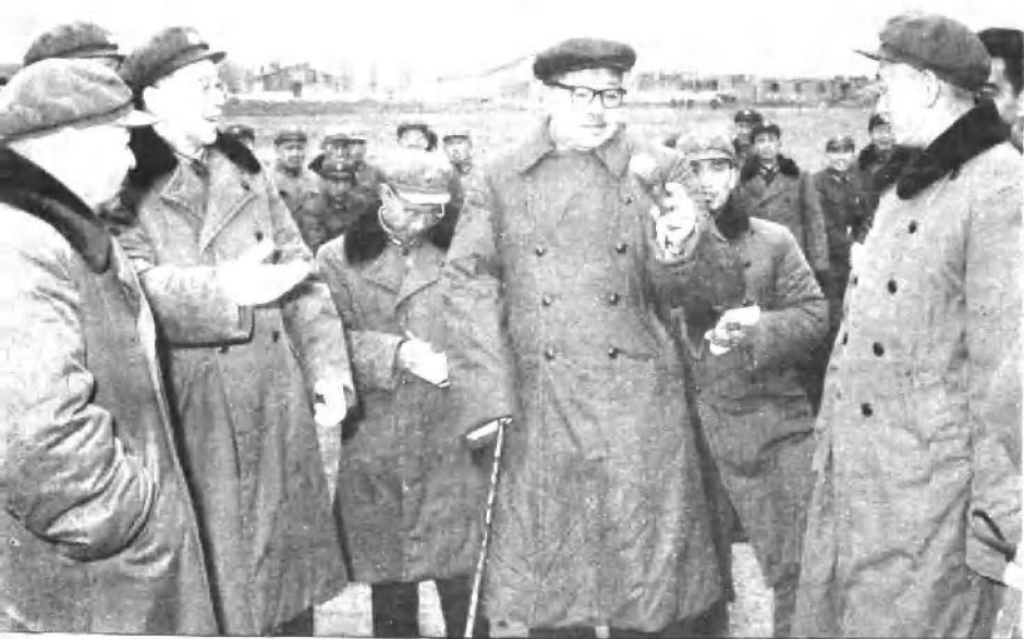
一九六四年，贺龙同志视察部队练兵情况，左二为廖汉生同志。