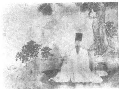
高攀龙画像 明代 (东林书院文保所藏)