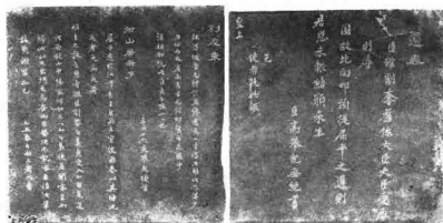
高攀龙《遗表》、《别友柬》拓片