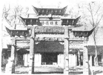
东林书院仪门前现存乾隆初年石牌坊