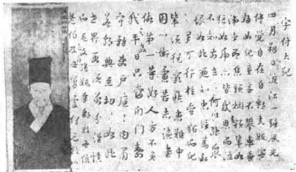
钱明昌像(清)及其《字行大儿》真迹(明) (镇江市博物馆藏)