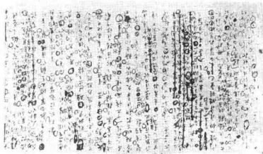
周宗建首勅魏碑“一丁不识”原疏稿默迹 明天启 (镇江市博物馆藏)