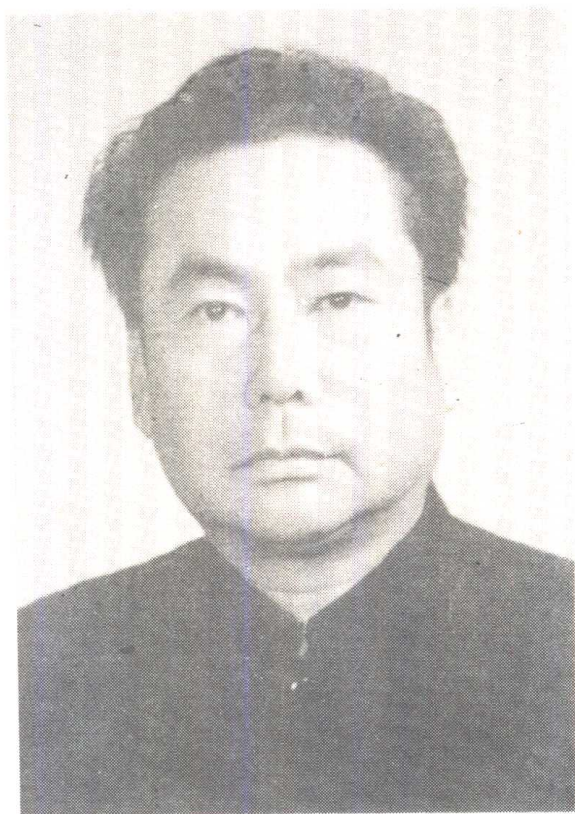
作 者 像