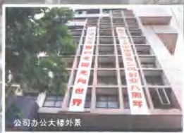
公司办公大楼外景