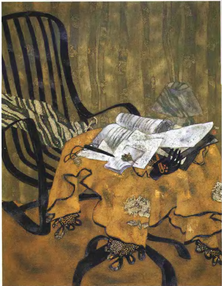
角落之二 1998年 纸本、岩彩、箔 116.7cm × 91cm