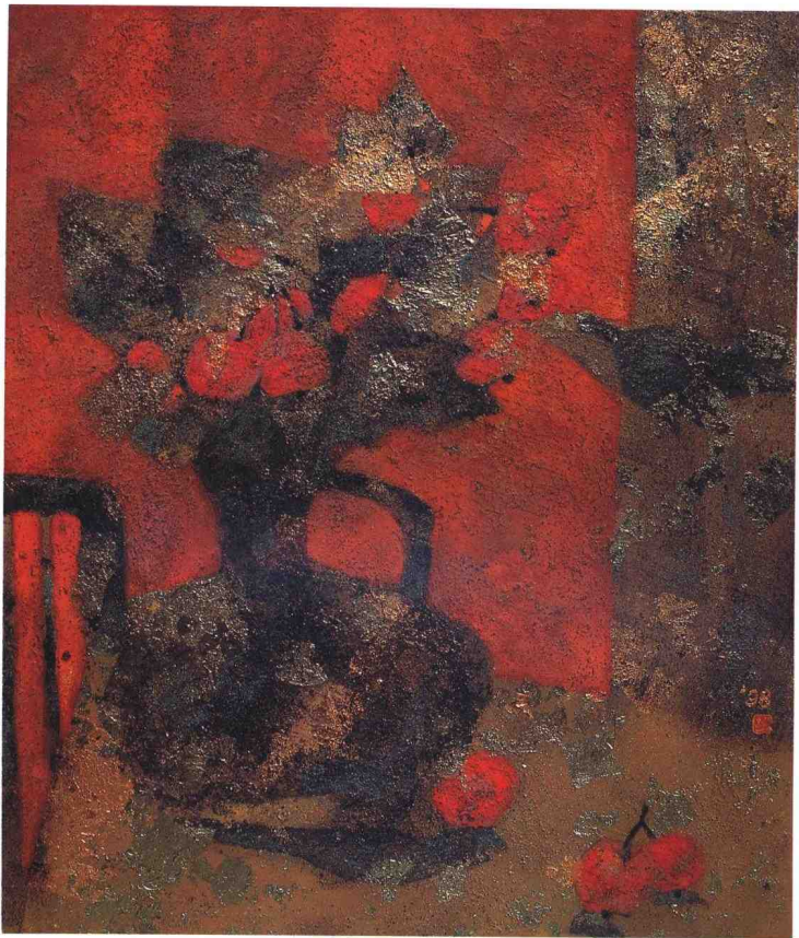
秋色 1998年 纸本、岩彩、箔 53cm × 45.5cm