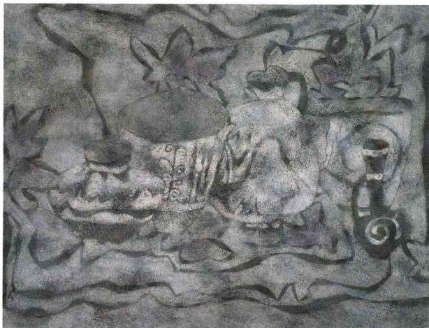
白陶纹 1998年 纸本、岩彩 91cm × 120cm