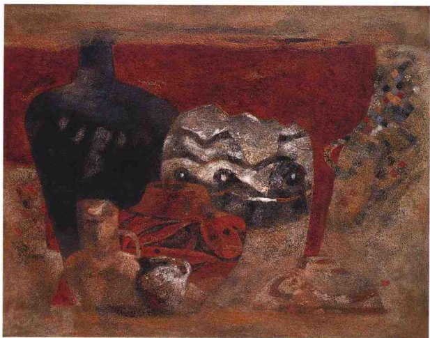
土陶纹 1999年 纸本、岩彩、箔 91cm × 116.7cm