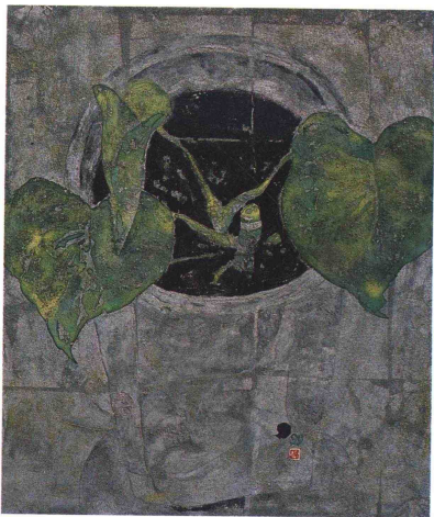
新叶 1999年 纸本、岩彩、箔 53cm × 45.5cm