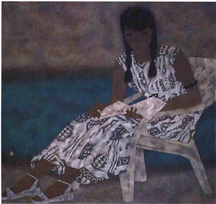
读之一 1997年 纸本、岩彩 145.5cm × 155cm