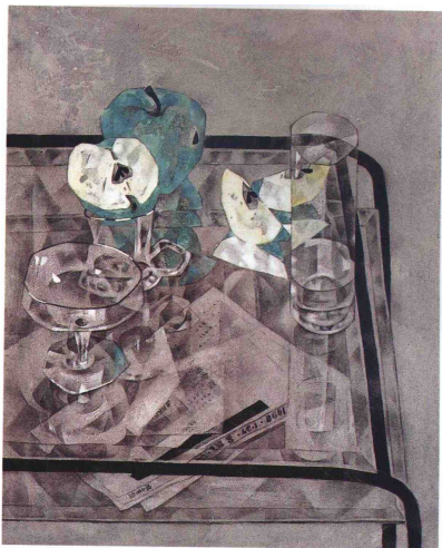
几 1996年 纸本、岩彩 60.6cm × 50cm