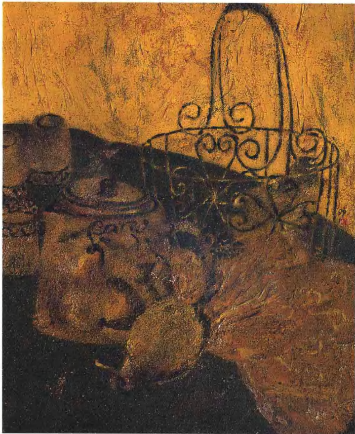
金色旋律 1999年 亚麻布，岩彩，箔 50cm × 60cm