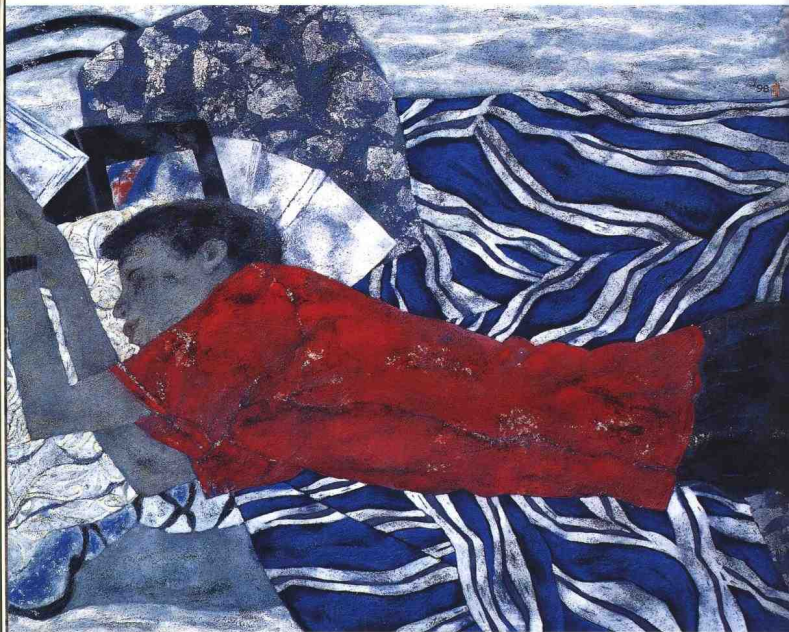
寻梦 1998年 亚麻木、岩彩、纸 145.5cm × 112cm