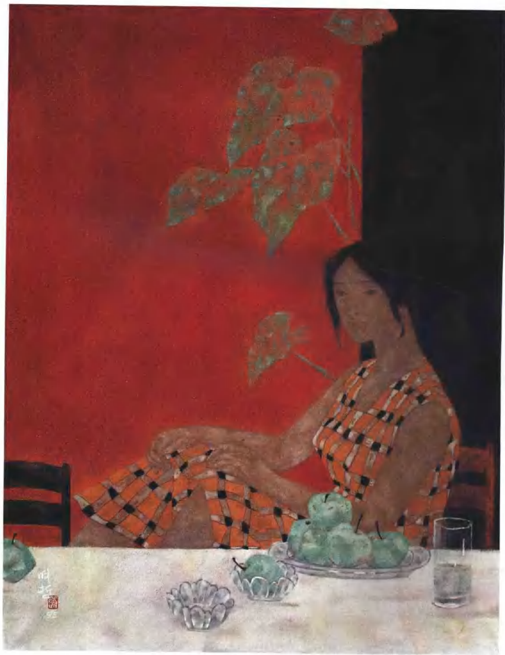
青苹果 1995年 纸本、岩彩 116.7cm × 91cm