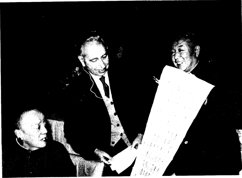
杨尚昆参加祝贺米勒七十寿辰大会