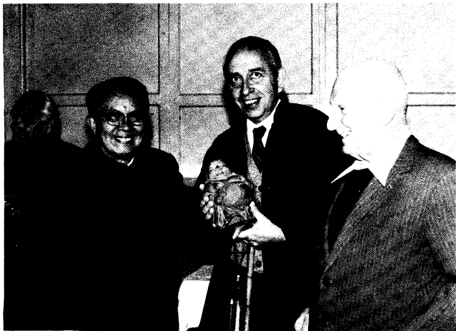
1985年黄华向米勒赠送礼物祝贺生日