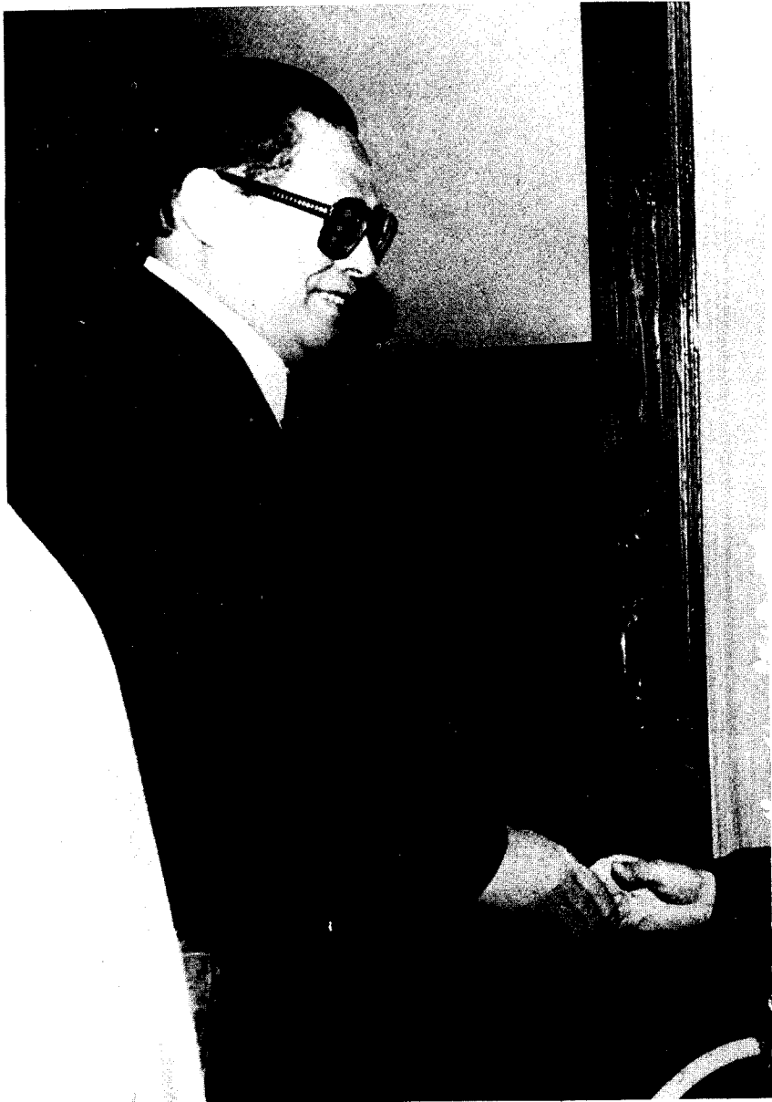
1989年11月11日江泽民会见米勒