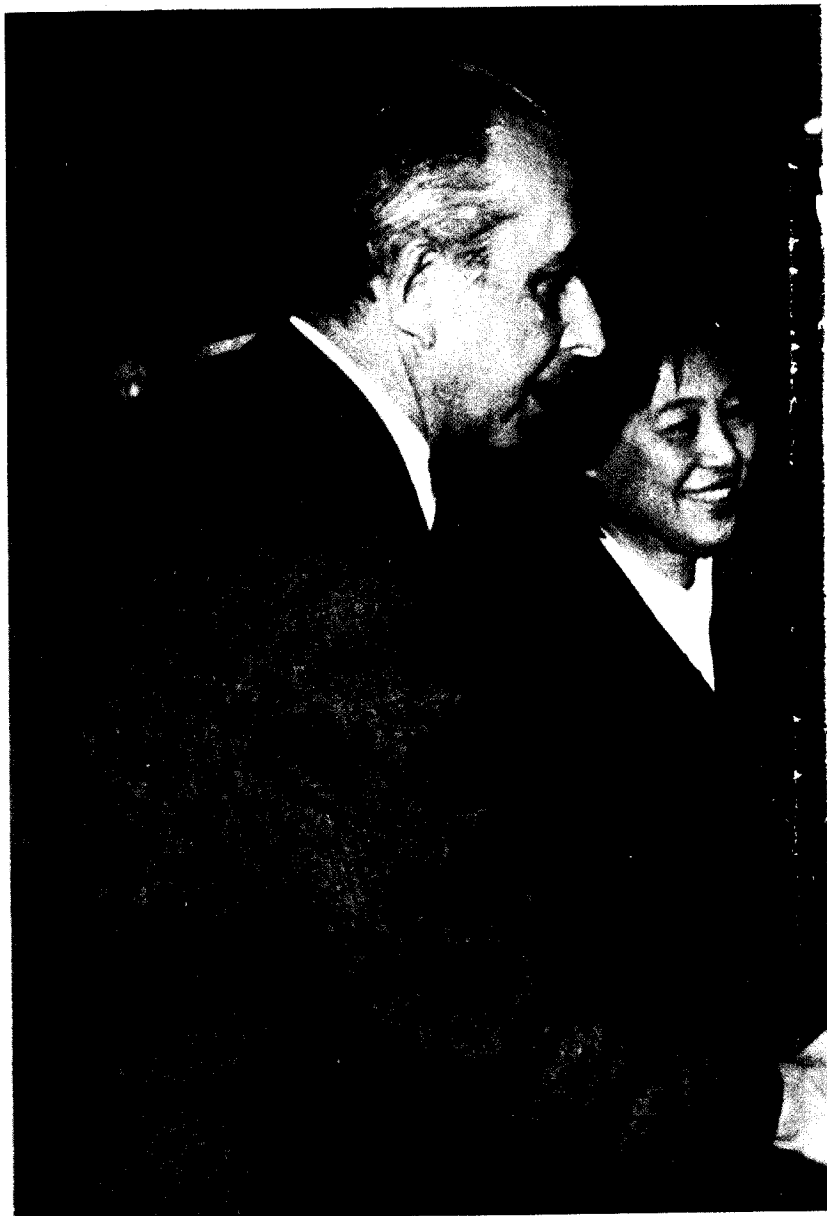
1982年邓小平会见米勒