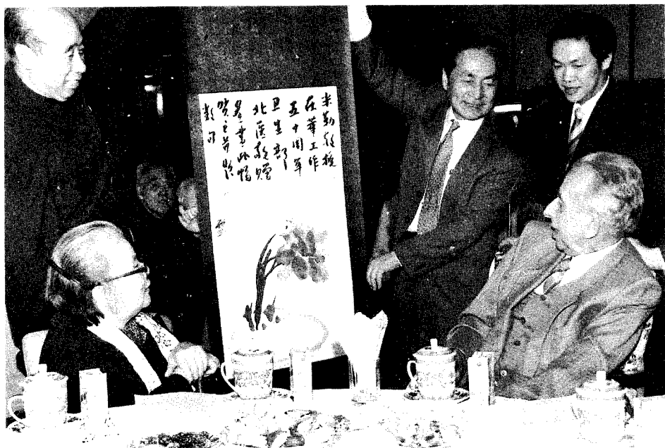
康克清祝贺米勒来华50周年