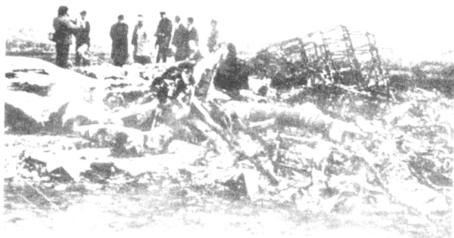
▲“九·一三”事件，256号三叉戟飞机在蒙古温都尔汗坠毁的现场。