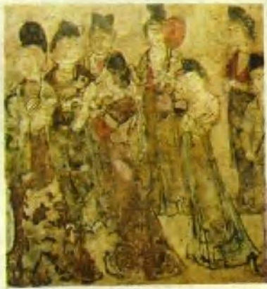
2 | 1 ①永泰公主墓出土壁画东壁 3 ②懿德太子墓出土西壁壁画 ③章怀太子墓马球图