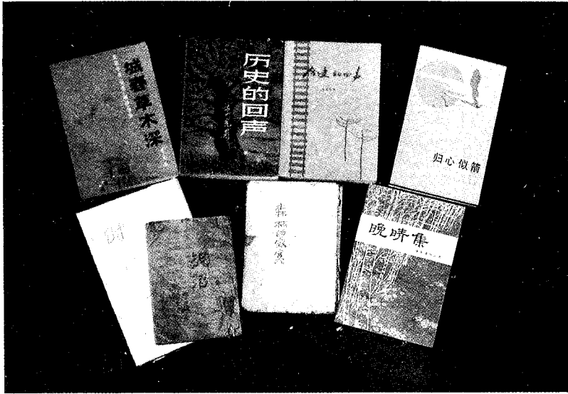
李克异所写的书集