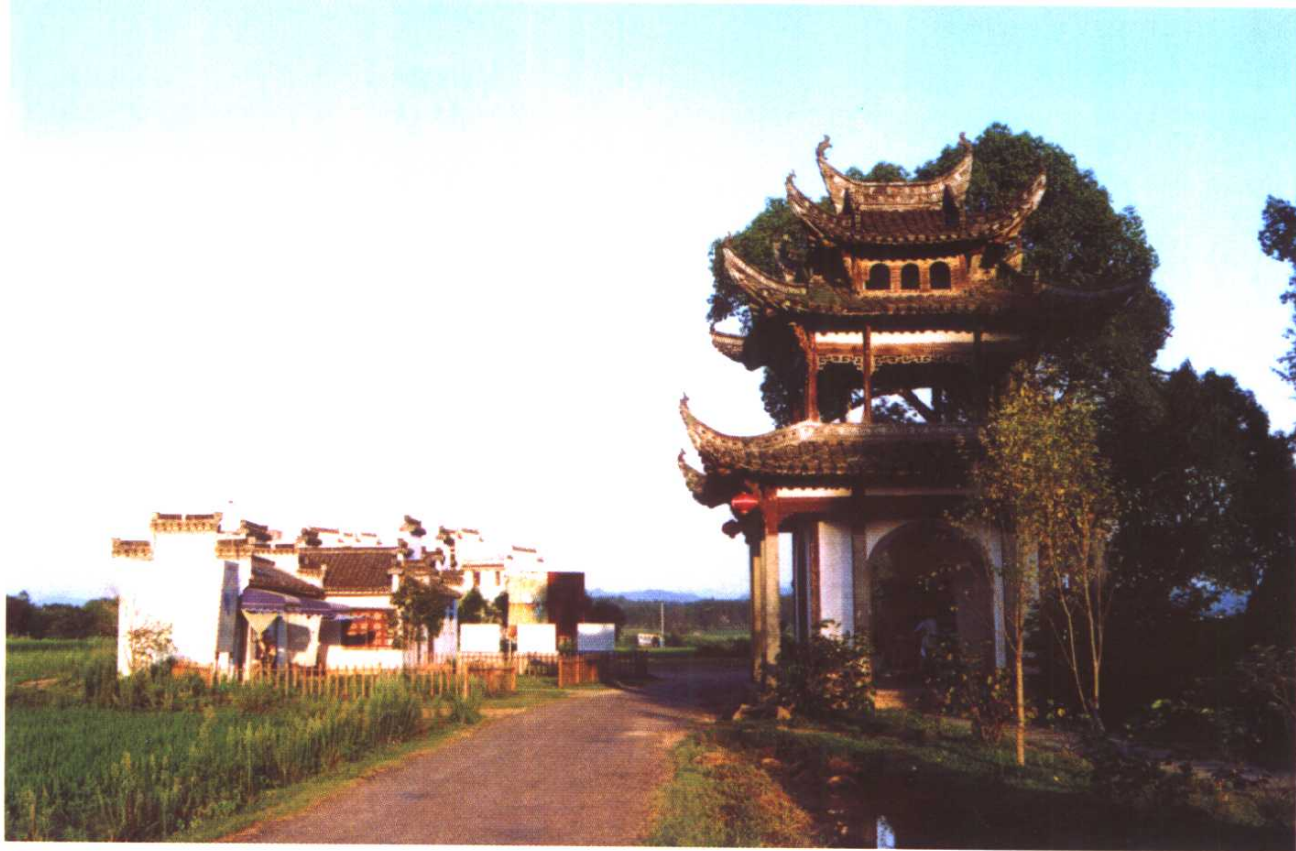
↑ 安徽歙县水街村口