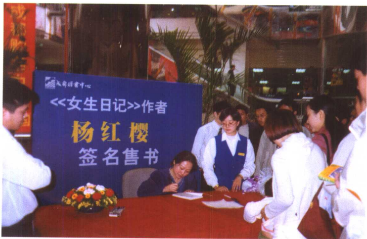
在成都购书中心参加《女生日记》的签书活动。