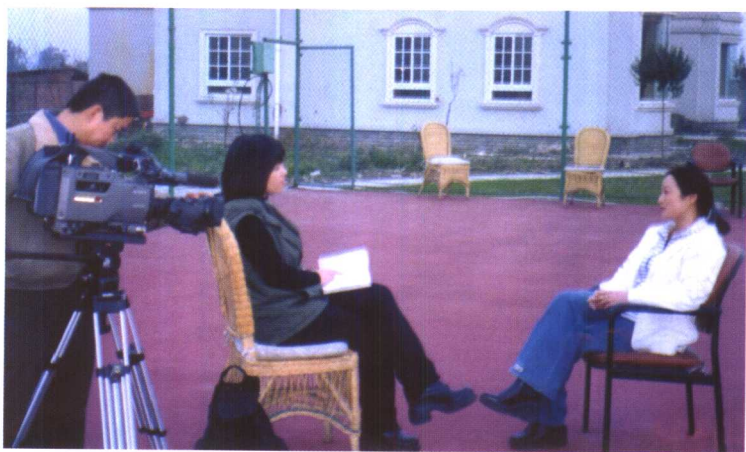
《女生日记》出版后，接受中央电视台专题采访。