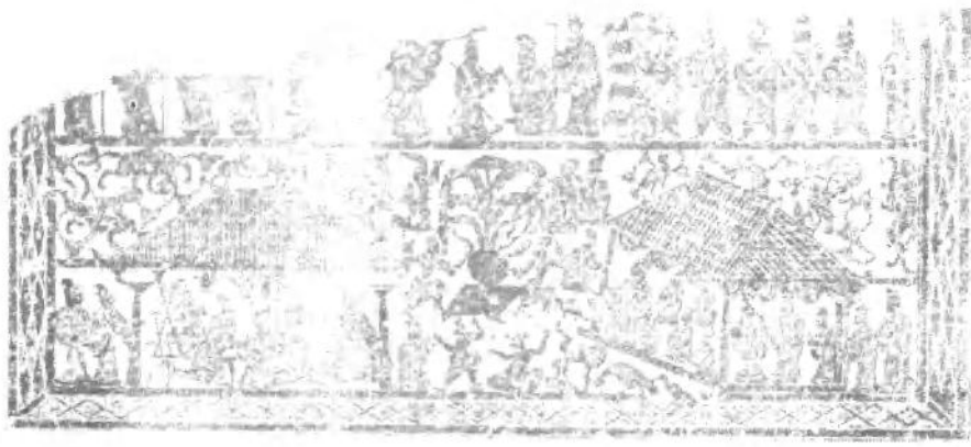
汉画像石：祠堂画像 铜山洪楼