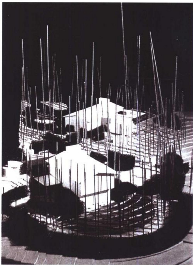
凯利早期的设计模型

凯利童年的大部分时光，尤其是夏天，都是在新罕布什尔的祖母家度过。新罕布什尔开阔的农业景观和纯净的自然风景给他留下了很深的印象。一排排