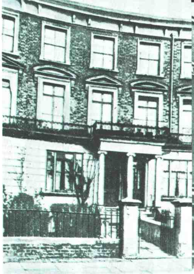
伦敦梅特兰公园 41 号 马克思家(从 1875 年——逝世止)