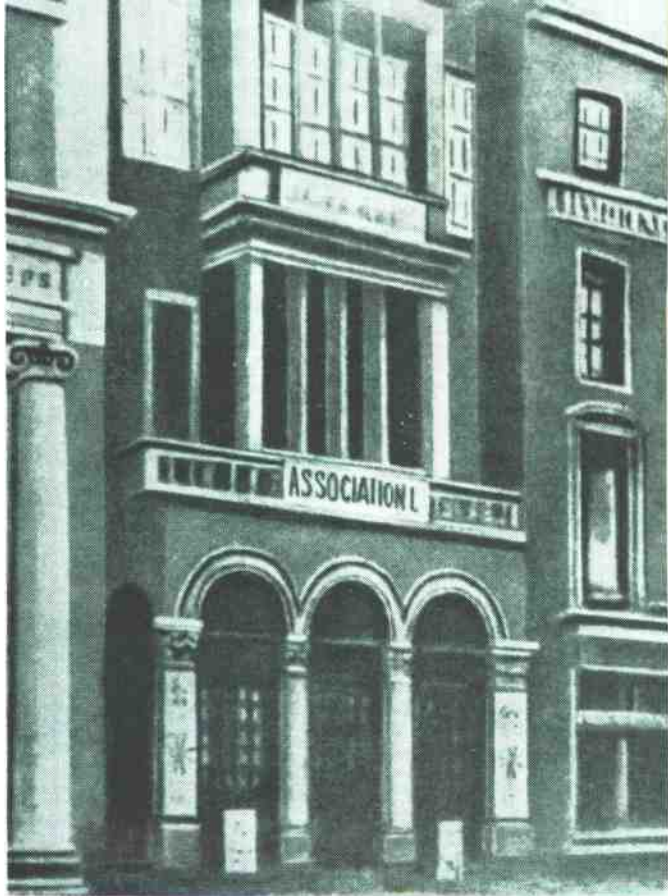
国际工人协会总委员会的会议地点 (1868年6月—1872年2月)