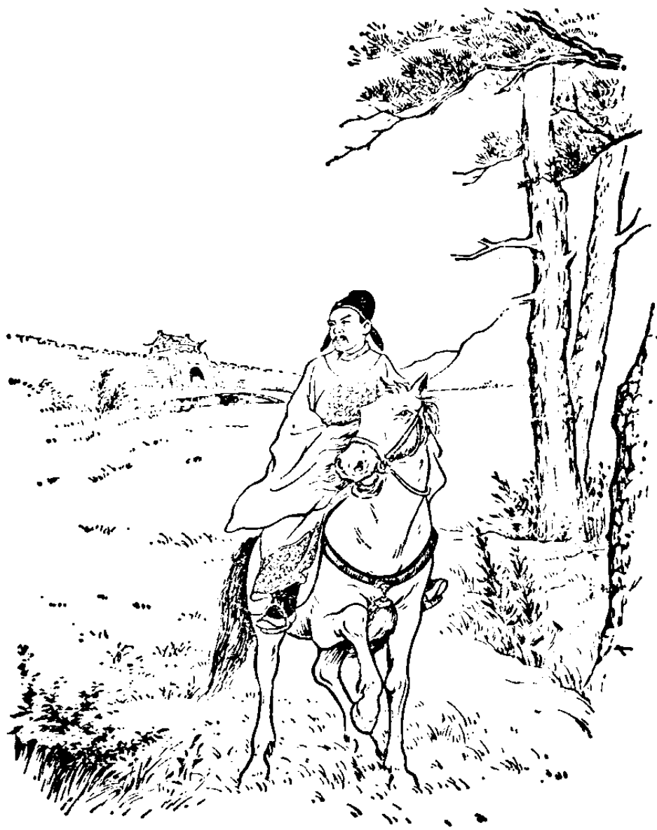
袁崇焕单身匹马到关外视察

广宁败报传来，朝廷里立刻弥漫了一片失望惊恐的情绪。就在这种情况下，袁崇焕到山海关内外去巡视了一番当地的地形。