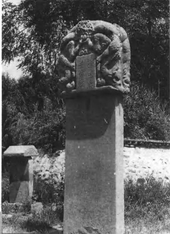
元 遗 山 墓