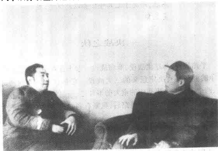
1948年毛泽东和周恩来在研究战局

战争进行了两年之后,到1948年秋,人民解放军不但粉碎了国民党军的战略进攻,使自己转入了战略进攻,并且使战争进入了双方以上力进行会战的战略决战阶段。