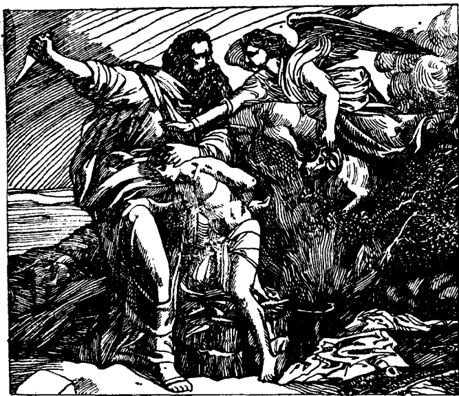
亚伯拉罕要杀儿子以撒献祭

儿子以撒捆起来放在木柴堆上，然后举刀要杀。就在这一刹那间，耶和华派来的天使抓住了亚伯拉罕的手，刀掉在地上。天使对亚伯拉罕说：“你不要杀死这孩子，现在耶和华已经知道你是虔诚的信徒了，因为你连自己的亲生儿子都舍得献给他”。由于亚伯拉罕经住了考验，耶和华给他赐福，答应让他的后代象天上的星星、地上的沙粒那样多。这件事情传开以后，希伯来人对耶和华就更加信奉和敬畏了。亚伯拉罕的威望也随着提高了。