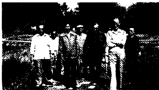
《在以西藏与中央关系》课题组在拉萨进行考察。