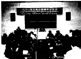
一九九一年北京中国藏学讨论会，藏研中心主持。

藏研中心一直十分重视对青年人的培养工作，老一代学者言传身教，把埋头苦干的敬业精神 and 严谨求实的学风传给青年研究人员，通过科研实践，不断提高他们的业务水平，还邀请国内外著名的专家学