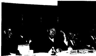
全国人大常委会委员长、第十世班禅额尔德尼·确吉坚赞在藏研中心第一次干部(扩大)会上讲话。