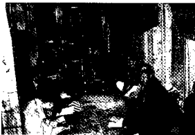
藏研中心藏研中心办公室

业出版社，1987年10月，又成立了国家级的专业杂志社《中国藏学》杂志社。藏学出版社内设藏文图书编辑部、汉文图书编辑部、英文图书编辑部(筹)、《中国藏学》藏文版编辑部、《中国藏学》汉文版编辑部等部门。现有工作人员30余人，其中编审1人，副编审4人，中级职称人员15人。