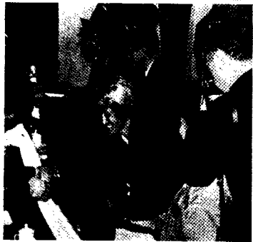
1983年，在北京召开的第四次全国藏学工作会议。

1951年，西藏和平解放，尽管国家经济有一定的困难，中央人民政府十分重视藏学研究的事业的创立和发展，先后在北京、西藏、四