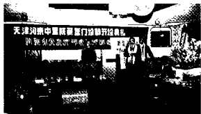
1994年12月，北京藏医院在天津河东区藏医院行址剪彩。

境。在不久的将来，藏研中心将建设成为大小建筑错落有致，树木葱郁，绿草如茵的花园式小区。