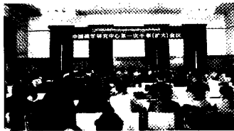
1986年5月20日在北京建立的中国藏学研究中心第一次扩大会议。