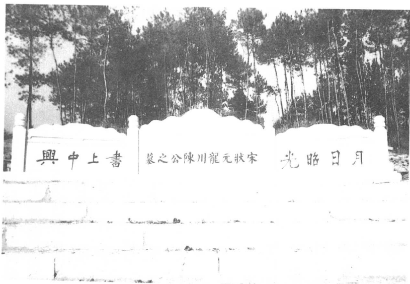
新修的陈亮墓。