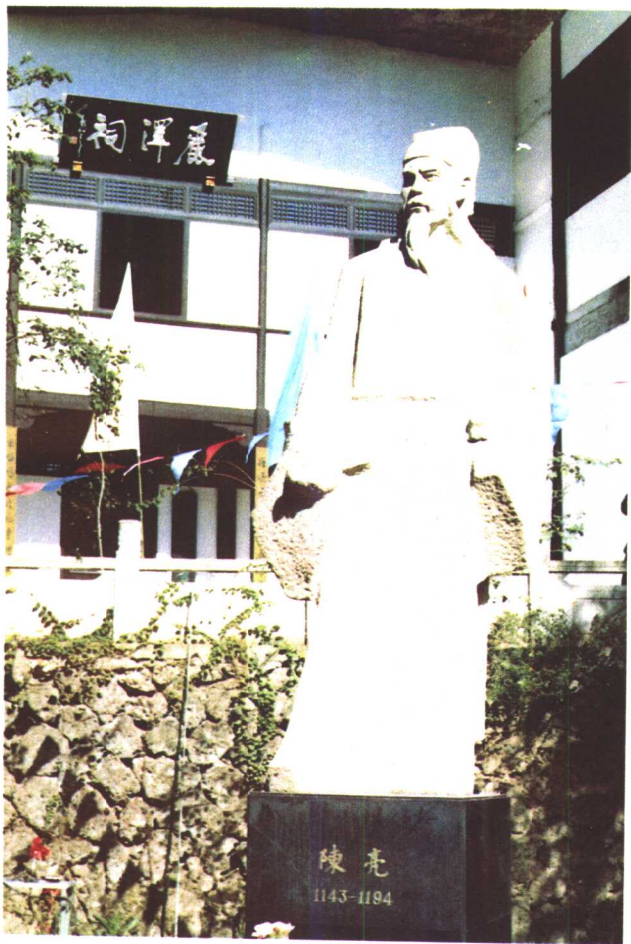
永康方岩五峰书院旁是丽泽祠，一九九三年十月永康市政府在祠前立陈亮雕像。